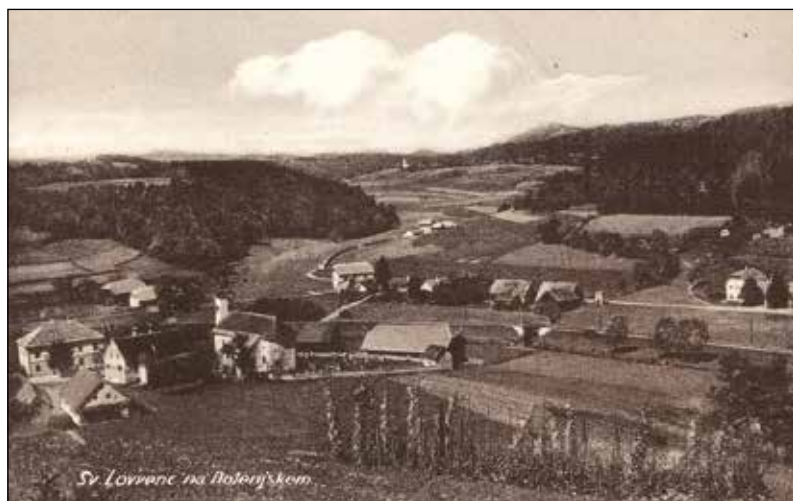
Sv. Lovrenc na Dolenjskem.