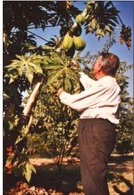
Vrt, obiranje papaje.