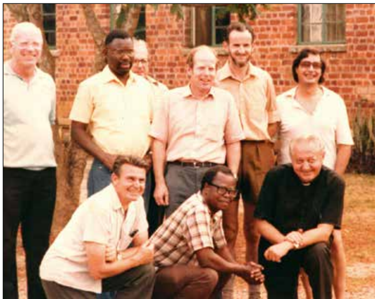
S profesorji v bogoslovju semenišča, leta 1981.

ličnih redovnih skupnosti: beli očetje, minoriti, jezuiti, betlehemci, afriški misijonarji ... Za svoje delo niso dobivali nobenega plačila, niti žepnine.