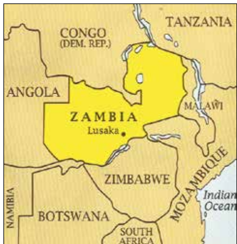
Zemljevid držav srednje in vzhodne Afrike.