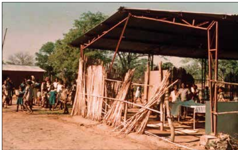
Šola Chembe v Kabwe (1967–1973), daleč v 'bušu'.

Po osamosvojitvi leta 1964 se je v Zambiji nadaljevala gradnja šol, s katerimi so začeli misijonarji. V začetku sedemdesetih let je bilo v škofiji Lusaka okoli sto različnih katoliških osnovnih šol, ki so jih vodili misijonarji. Razdeljeni so bili v dva centra: Lusaka in Kabwe. Samo na območju Kabwe je bilo 48 katoliških in okoli sto državnih osnovnih šol. Leta 1973 so bile vse šole poddržavljene. Ravno takrat je škof Mutala zaprosil jezuitski provinciat za pomoč