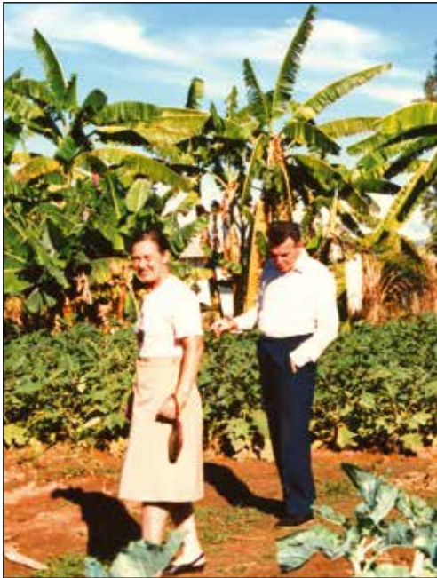
Na misijonskem vrtu v Zambiji.