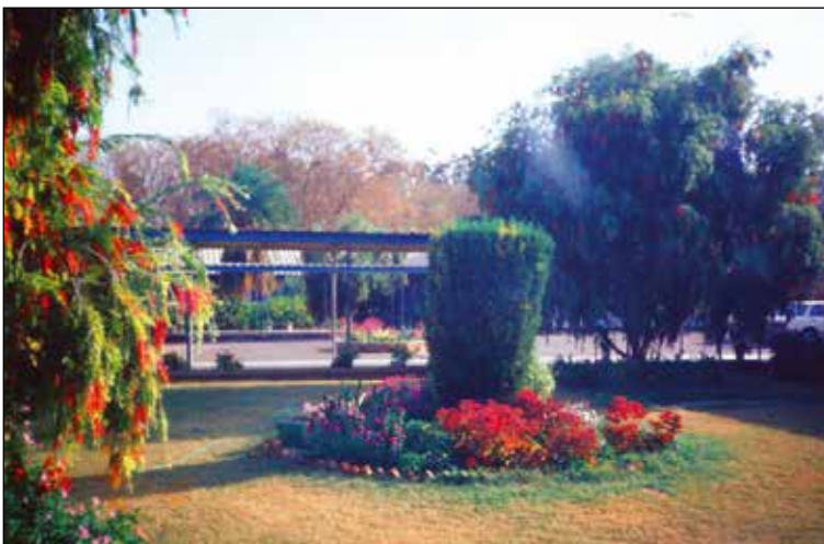
Pred noviciatom.