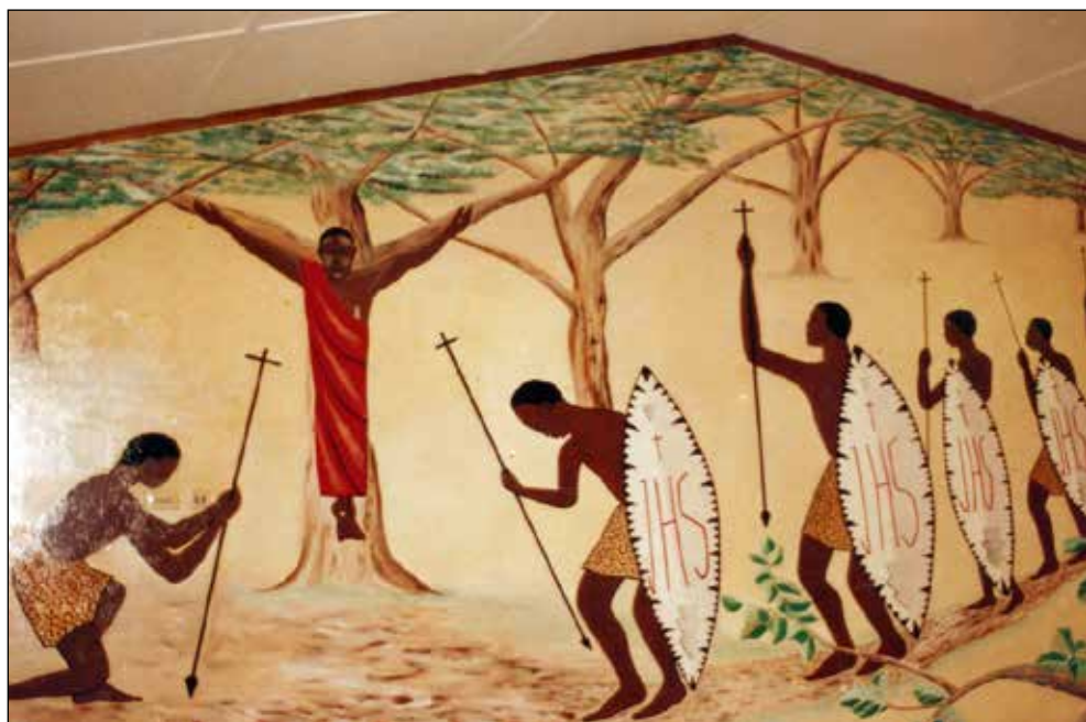
Kapela, noviciat.