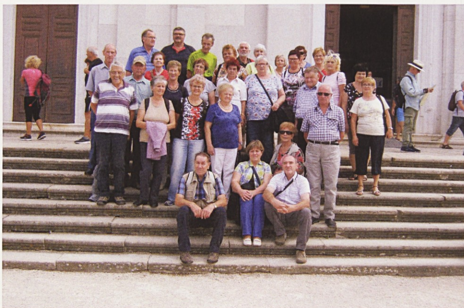
Z izleta po hrvaški Istri