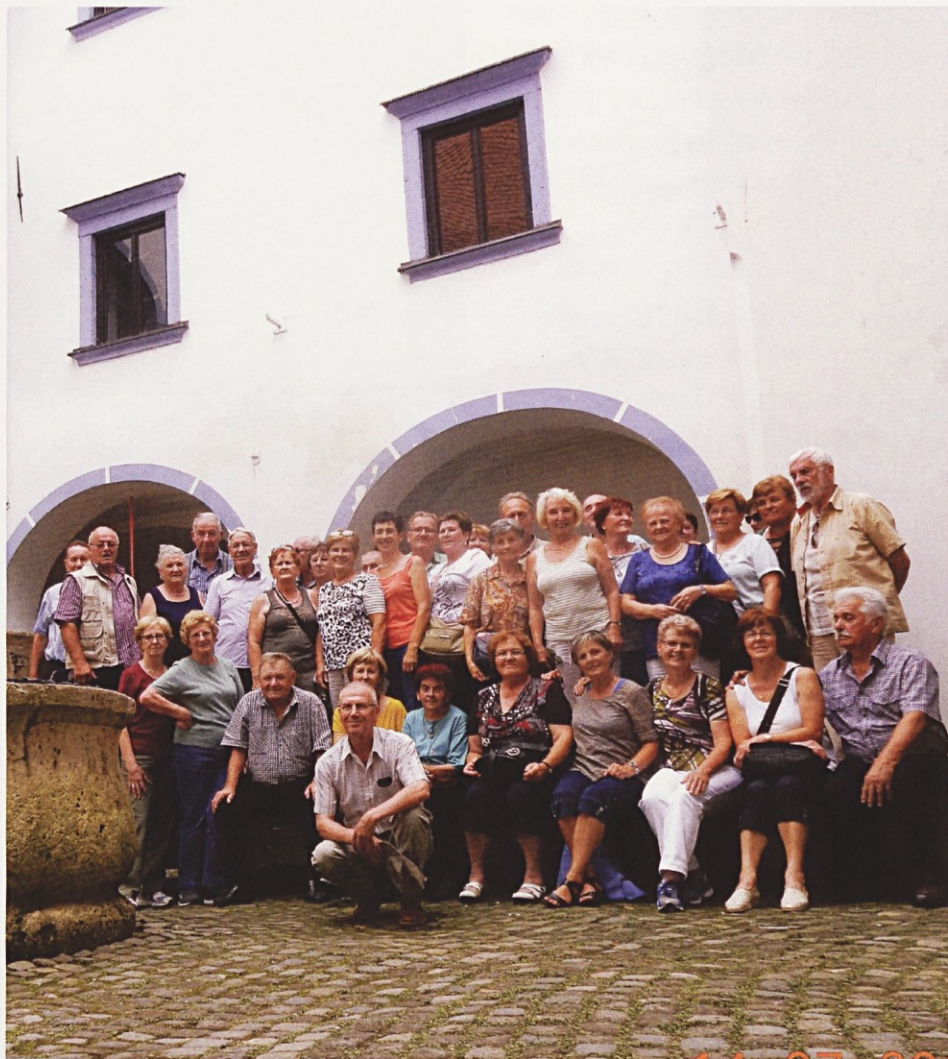
Z izleta »splavarjenje po Savi« skupinska slika na dvorišču sevnškega gradu

Hrvaška Istro, Poreč ... Tisto sončno soboto, 15. septembra smo se člani DU Il. Bistrica preko tunela pod Učko mimo Pazina zapeljali do Poreča. V zalivu nasproti Zelene lagune smo se vkrkali na ladjico, ki nas je popeljala ob slikoviti istrski obali mimo Vrsarja in največje nudistične plaže Koversade v Limski kanal vse do Gusarske pečine. Rahel vetrič je odgnal oblake, ki bi lahko pokvarili dan. Po izkrcaanju smo se podali skozi zanimive in s turisti natrpane kamnite ulice in se povzpeli do mogočne katedrale, posvečene sveti Evfemiji,