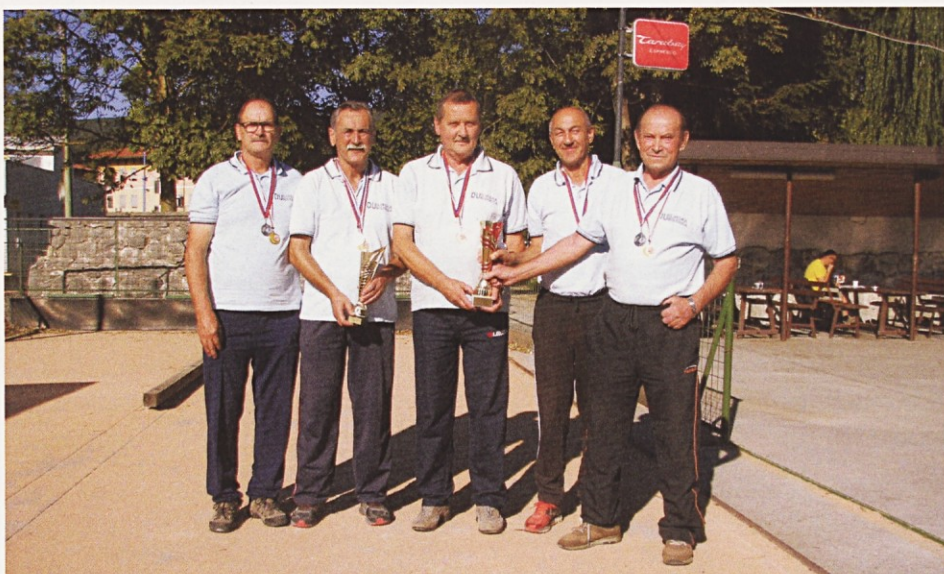
Moška balinarska ekipa z osvojenimi medaljami in pokali

V septembru je društvo organiziralo balinarski turnir, na katerem so se izkazale domače ekipe, ki so tako pri moških kot pri ženskah osvojile 1. mesto. Veliko