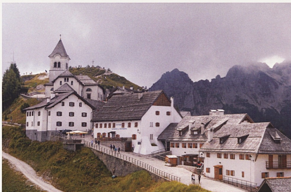
Z izleta »na Sv. Višarje« – pogled s postaje nihalke