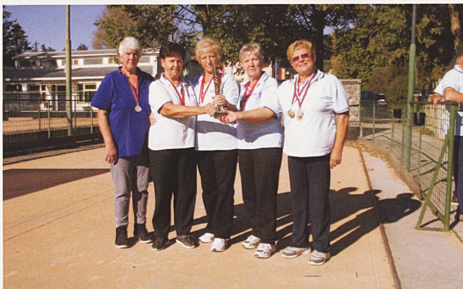
Ženska balinarska ekipa z osvojenimi medaljami in pokalom