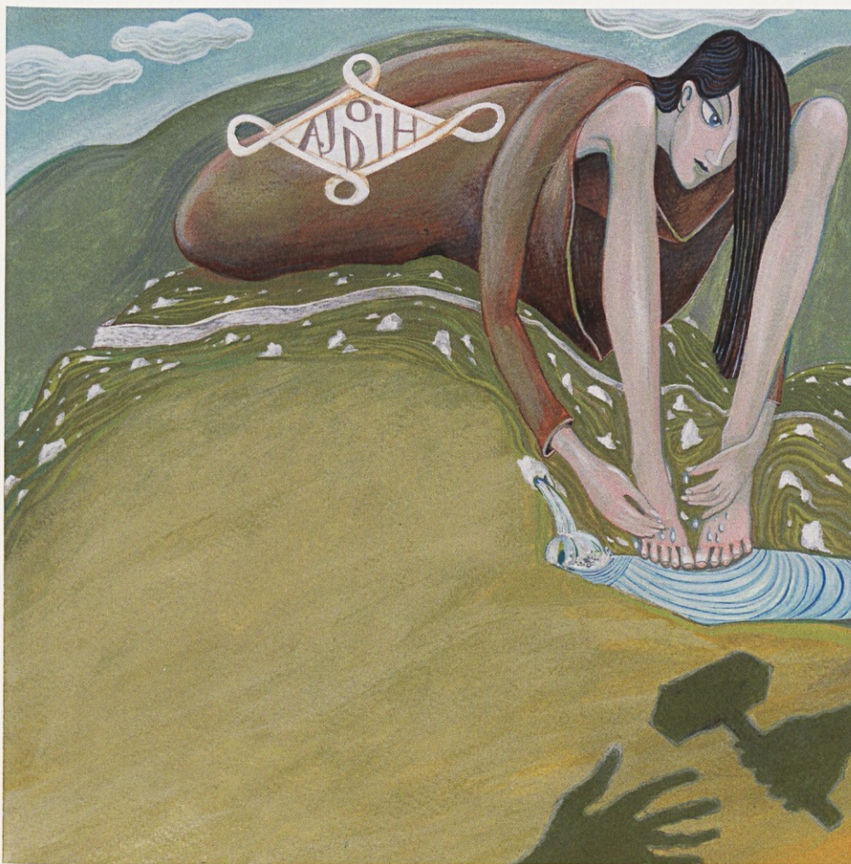
Ajda v slikanici Pravijsko, da... avtorja Romea Volka