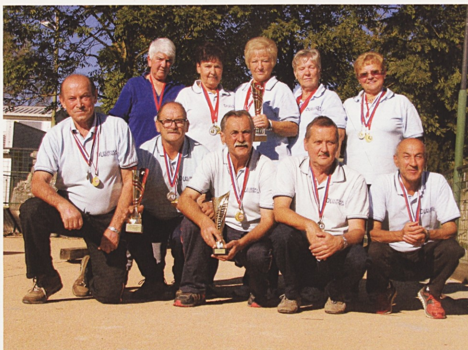
Moška in ženska balinarska ekipa