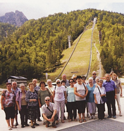
Z izleta »na Sv. Višarje« – skupinska slika pod velikanko v Planici