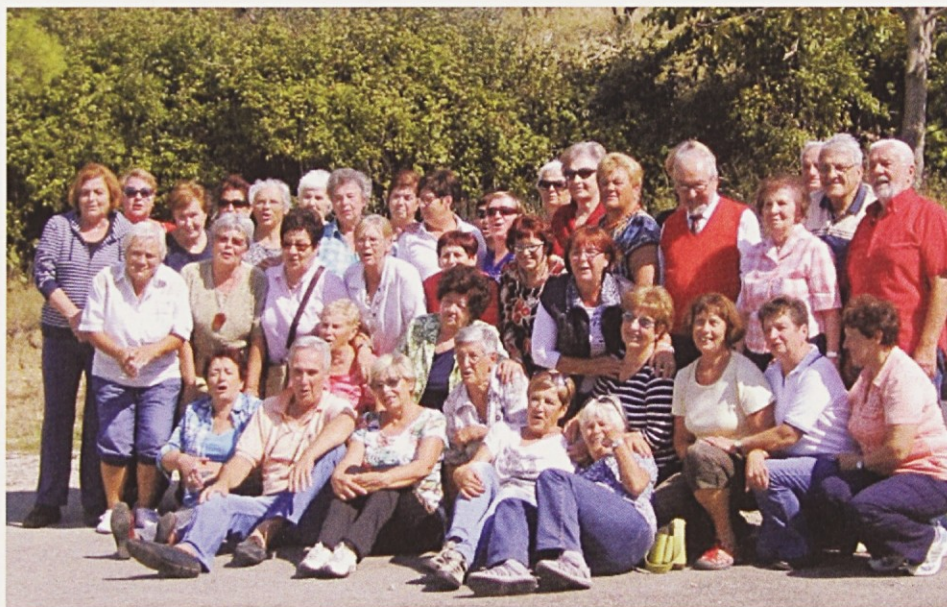
Druženje prostovoljcev na letnem srečanju v Dekanah, 2015