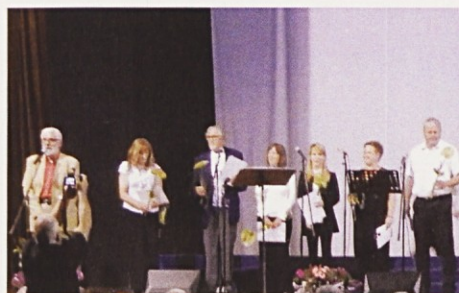
Zaključek revije upokojenskih pevskih zborov – podelitev priznanj

Revija upokojenskih pevskih zborov DUPZ Južne Primorske V dvorani Doma na Vidmu je bilo v petek, 22. 6. 2018, slovesno. Južnoprimorska pokrajinska zveza društev upokojencev in domače upokojensko društvo sta organizirala IX. revijo upokojenskih pevskih zborov s tega območja. V uradnem delu programa