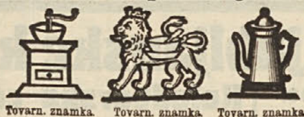
Tovarn. znamka. Tovarn. znamka. Tovarn. znamka.

da imate jamstvo za vedno jednako in najboljšo kakovost. — Pazite pri tem na varstvene znamke in podpis, kajti naše zamotanje se v enakih barvah, papirju in z podobnim natisom ponareja. —