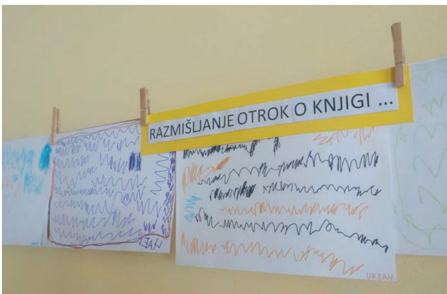
Razmišljanje otrok o knjigi

Projektno delo temelji na izkustvenem učenju, zlasti na skupinskih oblikah dela in na reševanju konkre-