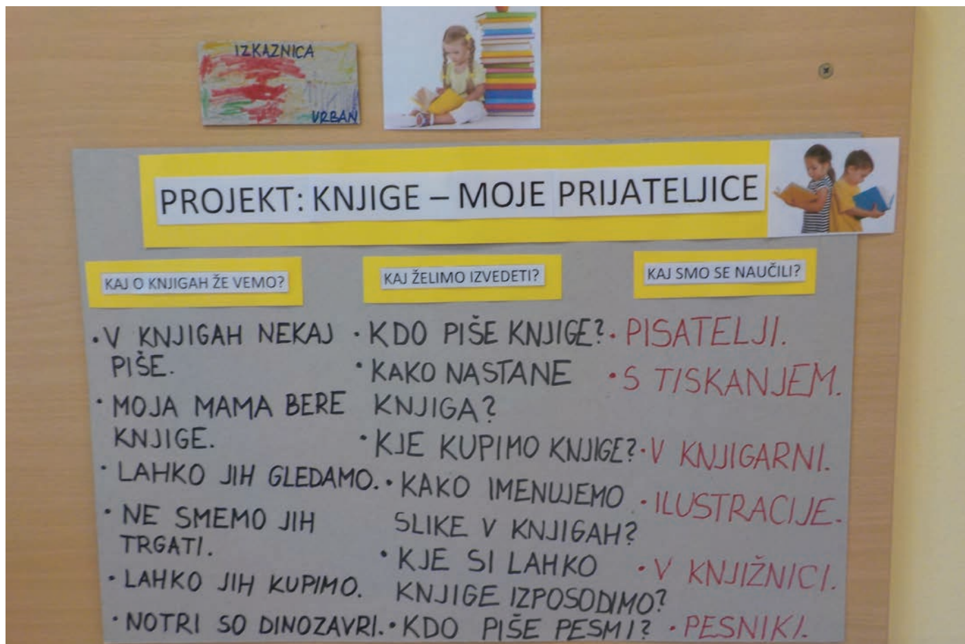
Naš plakat: Knjige – moje prijateljice

aktivnega učenja poveča participacija otrok v dejavnostih, njihova motivacija in kakovost naučenega. Uporabljene tehnike aktivnega učenja so pripomogle k temu, da so aktivno udeležbo razvili vsi otroci, tudi manj komunikativni, zato jih bova uporabljali tudi v bodoče.