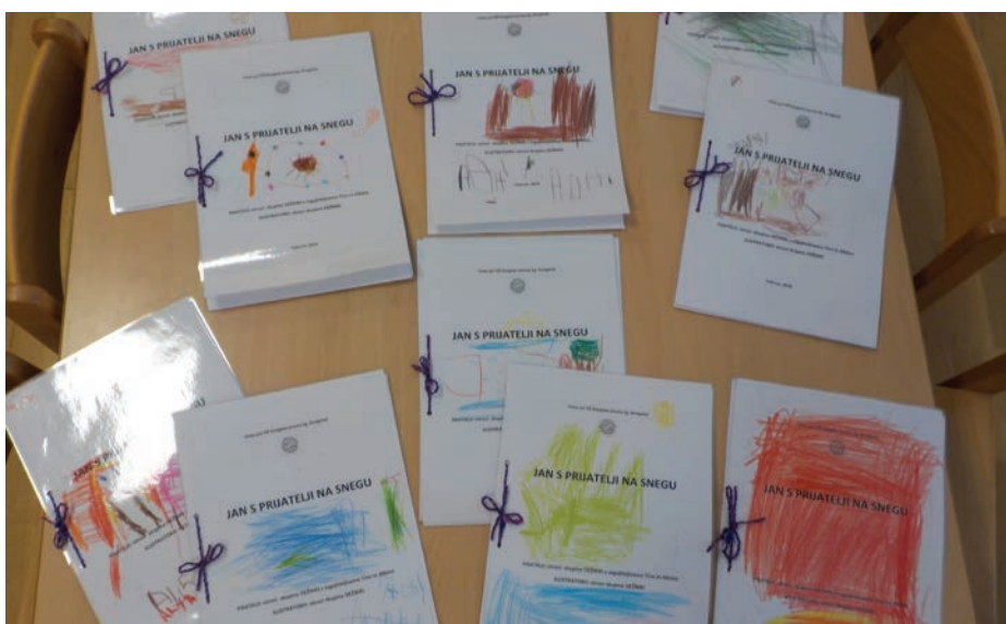
Naše knjigice, ki so jih ilustrirali otroci.