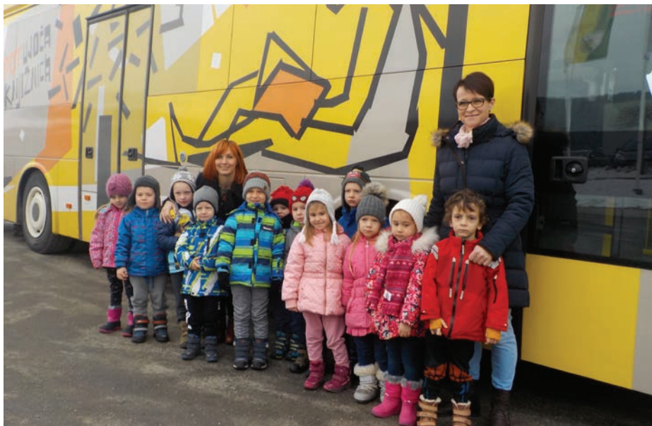
K nam je pripeljal bibliobus.