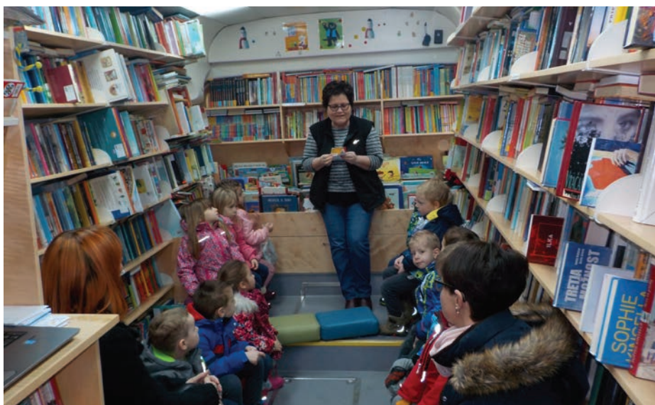
Koliko knjig je v bibliobusu!