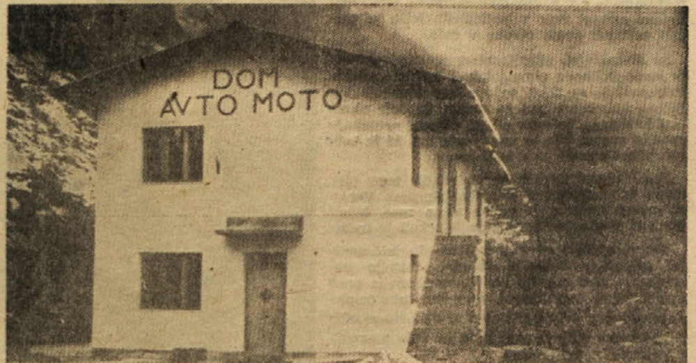
Dom AMD v Litiji, ponos vseh članov.