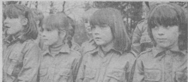
Ob dnevu slovenskih tabornikov - taborniški odred Louis Adamič, Grosuplje.

(pripravila Anuša Vidmar)