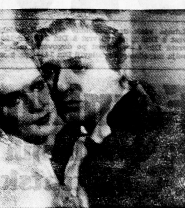
Film »Prepovedana ljubezen« (Manon Lescaut) je dobil v Italiji prvo nagrado in njegov režiser, slavni Carmine Galone je izjavil: »Film Manon Lescaut je moje življenjsko delo...« Premjera jutri v kinu Matici! 2531

Film velja kot eden najkvalitetnejših italijanskih sploh. Vsebinska je izražena s par besedami: »...ljubezenska zgodba duhovnika, ki ljubi živo in globoko, toda nedovoljeno...« Romance poje najboljši tenorist sveta, Benjamin Gigli.