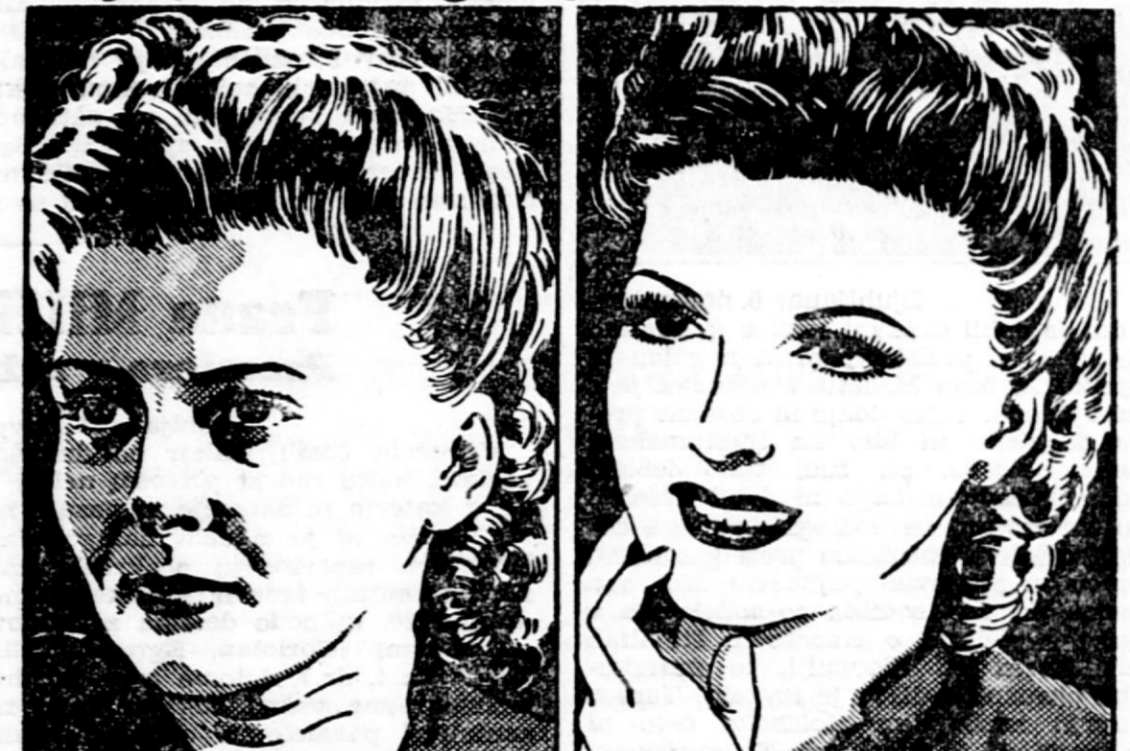
Gospodična Brassade pripoveduje, kako je poslala na videz za mnogo let mlajša in še enkrat bolj privlačna

Poglejte te fotografije iste mlade dame!