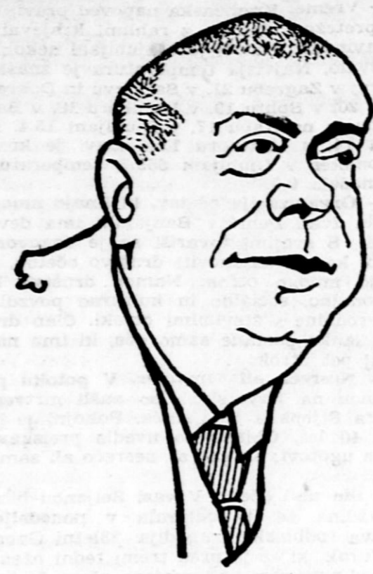
Burka je ko nalašč ustvarjena za ljudi, ki se radi smejejo preprostim, neproblematičnim zgodbicam. M. S.

ščina s »kuheltaičem« in so bile uradniške plače kljub dobrim, mirnim časom preznike. Inspektorji so bili strogi gosposke, stalni gostje v gostilni so razdirali šale in kritizirali postrežbo, dekleta so bila »dresirana« na lov za ženini in ti so se branili zakonskega jarma. Apropos, »zakonski jarem«. Tega si je Milčinski izposodil in je napravil na račun zakonskih mož marsikatero šalo.