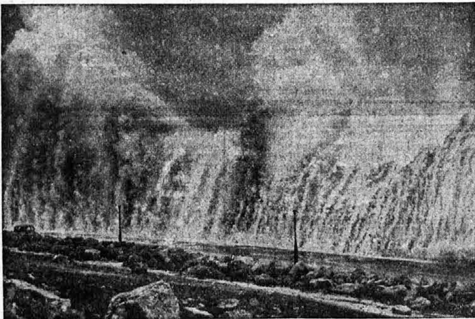
Ob angleški obali so zadnjič divjali siloviti morskiviharji, ki so naredili tudi tale visok vodni zid.