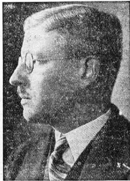
„Avstrija je krščanska država.“

S številkami je nato kancler podprl svojo ugotovitev, da je Avstrija v zadnjih letih gospodarsko močno napredovala, dvignila svojo produkcijo na vseh poljih ter zmanjšala za polovico svoje zunanje dolge. Govoril je zlasti o uspešnih ukrepih v korist tujškega prometa in obljubil nove olajšave, ki bodo privabile v številna avstrijska letovišča še mogočnejše število tujcev.