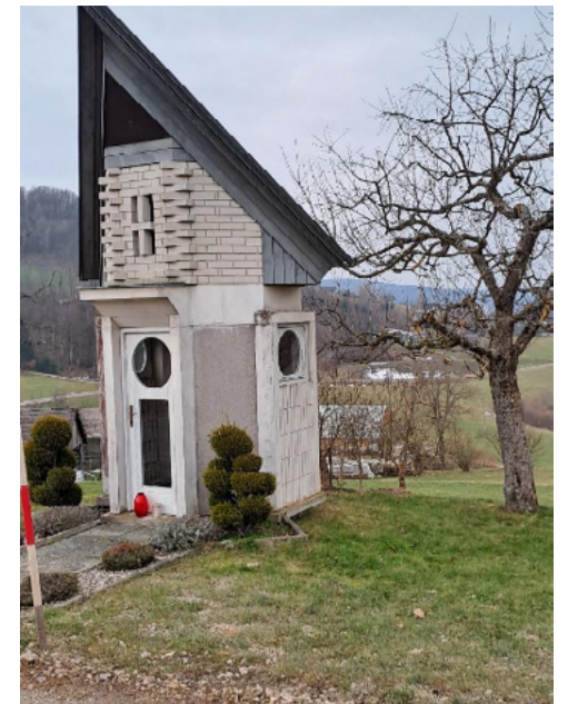
Paradižarjeva kapelica v Srednjem Lipovcu

Slopasto Pižmovo znamenje na Dvoru se imenuje po bližnji Pižmovi domačiji. Stoji ob glavni cesti na Dvoru, blizu odcepa poti proti Vinkovemu Vrhu. Zgrajeno je bilo leta 1737 v zahvalo, ker so bili Dvorjani takrat obvarovani kužne bolezni. Ima stebirsto obliko in so