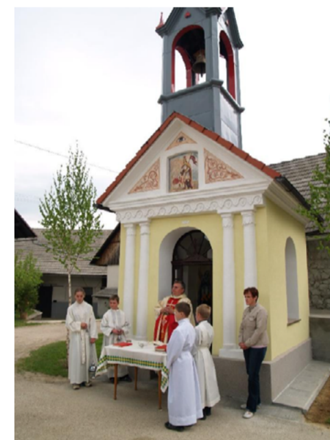
Kapelica Sv. Antona na Podlipi

Kapelica Sv. Antona na Podlipi stoji sredi vasi Podlipa, v senci mogočnega kostanja. Po izgledu je to ena najlepših kapelic v župniji. Je štirikotna, z oknom na levi in desni strani. Nad streho se dviga majhen stolpiček – zvonik. Konstrukcija stolpiča je lesena, oblečena v pločevino. Na oltarčku je postavljen kip sv. Antona Padovanskega, pod njim je upodobljen mrtvi Jezus v božjem grobu, ob njem je angelček. O nastanku kapelice ni podatkov. Morda so jo zgradili po velikem požaru, ki je leta 1901 uničil 41 poslopij devetih gospodarjev. Na to kaže podoba sv. Florjana nad vhodom v kapelico.