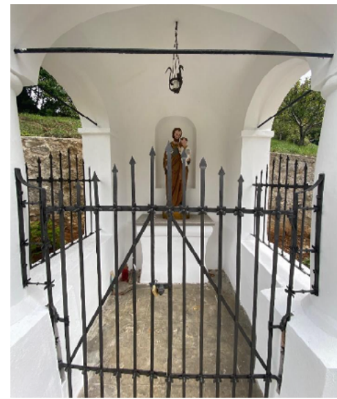
Notranjost kapelice s kipom Sv. Jožefa z Jezusom