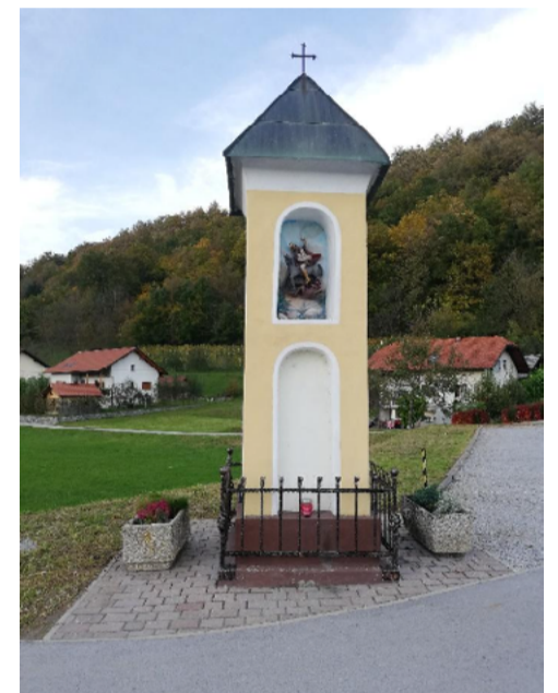
Slopasto Pižmovo znamenje na Dvoru

ga prvotno krasile štiri freske. Leta 1989 so znamenje dvignili za en meter, ga lepo obnovili, freske pa zamenjali s kipci pleterskega meniha. Ograjen je s kovano ograjico. Delo so opravili Dvorjani v sodelovanju s tedanjo Krajevno skupnostjo.