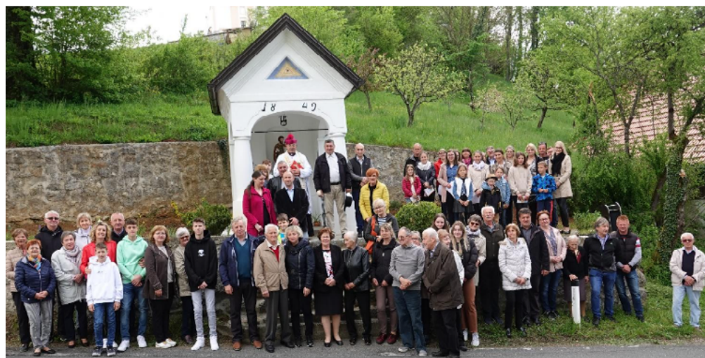
Po blagoslovu kapelice sv. Jožefa, 30.04. 2023