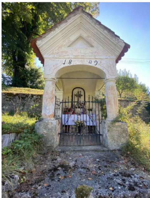
Kapelica pred obnovo

Raziskovalna naloga Znamenja in kapelice v KS Žužemberk, OŠ Žužemberk, 1995