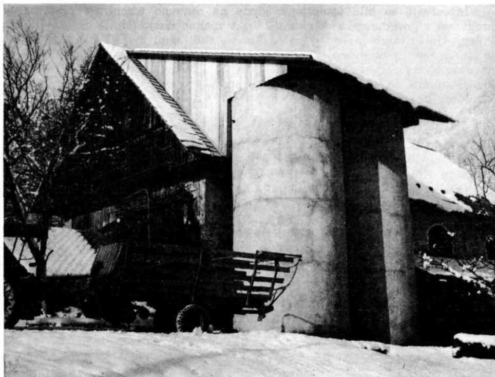
Novo zgrajena silosa in samonakladalna prikolica na usmerjeni kmetiji Matevža Demšarja, Log št. 2

1966 prodali ravninski kmetje približno 75 % vseh odkupljenih količin krompirja, leta 1975 pa skoraj 97 %. Pridelovanje krompirja zahteva namreč veliko strojnih opravil, ki jih je možno opravljati le na ravnih oziroma na malo nagnjenih terenih.