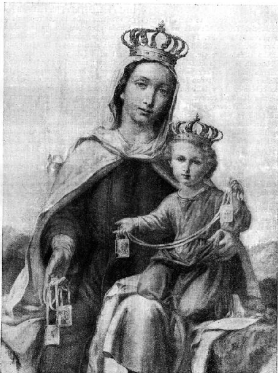
Za 16. julija: Praznik Karmelske Matere božje.

vojska» v Mariboru, dvigni se k novemu delu in boju! O priliki velikega orlovskega tabora bomo imeli — in sicer v ponedeljek 2. avgusta — tudi tabor »Svete vojske«. Pridite takrat vsi zraven, ki vam je kaj na tem, da bi bil naš