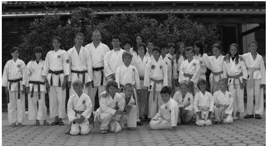
Udeleženci poletne šole karateja.

Poletna šola je bila po vsebini in količini treningov kar zahtevna, saj je poleg štirih tehnično in kondicijsko zahtevnih treningov na dan vsebovala zgodnje vstajanje, kar je bila kar velika težava za marsikoga, ki tega ni vajen. Utrjevali smo znanje članov iz Shotokan karateja (tehnične kihon ter boja z nasprotnikom kata in kumite) na nivoju, prilagojenem znanju in izkušnjam. Del treningov smo posvetili učenju novih znanj, predvsem kat, kjer so se predvsem rjavi pasovi naučili mojstrsko kato kanku dai, ki jo bodo potrebovali pri opravljanju izpita za črni pas (1. dan). Da ne bi bilo prenaporno, smo sredi tedna odšli na izlet z ladjo do Rovinja.