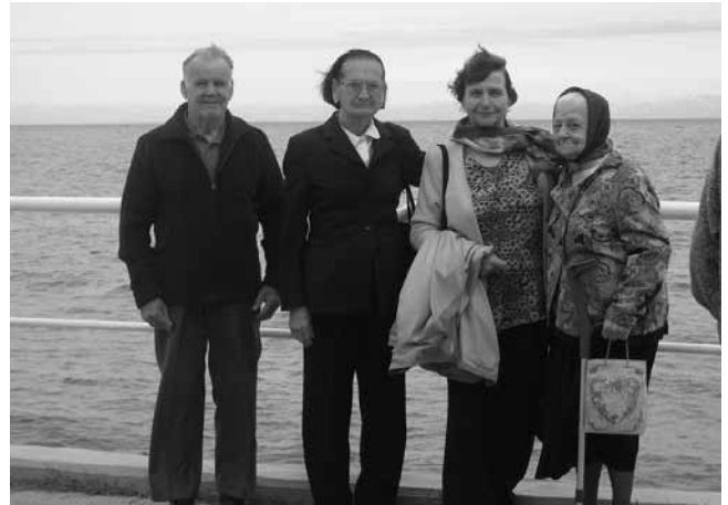
Na izletu ob morju je bilo lepo.

Imeli smo tudi razvedrilno popoldne s tombolo v dvorani v tretjem nadstropju. Navdušeni smo poslušali, iskali in črtali številke, da je kar hitro minilo. Nagrade so bile simbolične. Glavni dobitek je bil nahrbtnik. Bilo nas je kar precej, da nam je popoldne hitro minilo. Obiskali so nas tudi otroci iz vrtca Kurirček. Bilo jih je šestindvajset in vsak je povedal svoje ime. Otroci so nam nekaj zapeli in zaplesali. Prvi pesmi sta bili Rimski pozdrav ter Lisička je prav zvita zver. Sledila je igrica »vsi so jedli, vsi so pili, vsi so delali tako«, na katero so zaplesali in zapeli. Sledila je