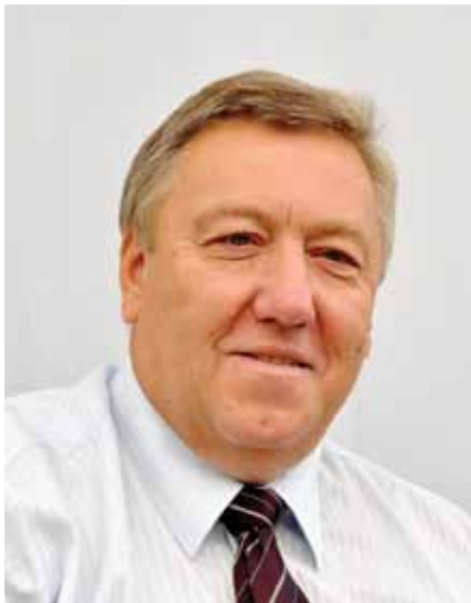
Naročnik: OO SDS Logatec, Tržaška c. 11