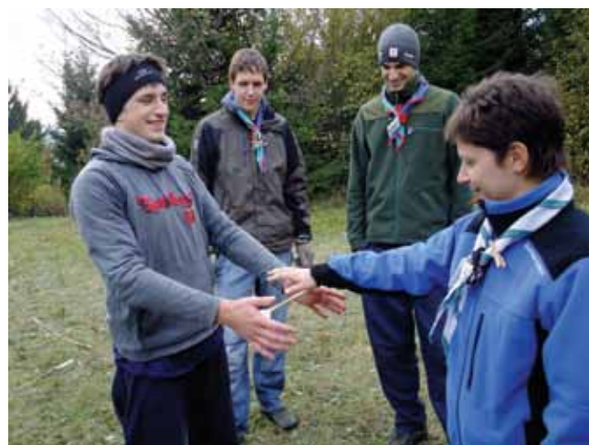
Na eni od postaj so s pomočjo kuhalnice preskusili reflekse skavtov.