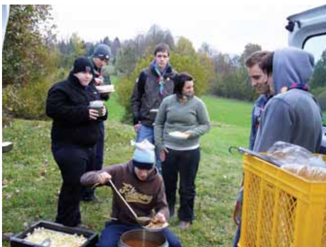
Ekipe na terenu se je razveselila golaža, ki so jim ga za večerjo pripeljali na Ravnik pri Hotedršici.