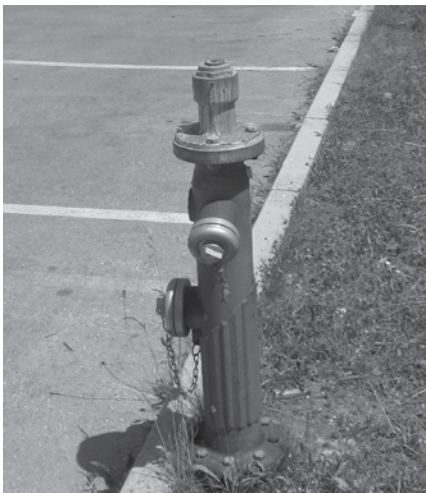
Ventil na glavi hidranta je odtrgan.