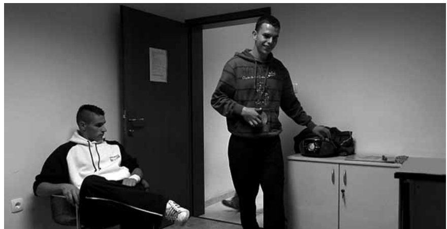
Mladi v Hotedršici so le prišli do prostorov za druženje.