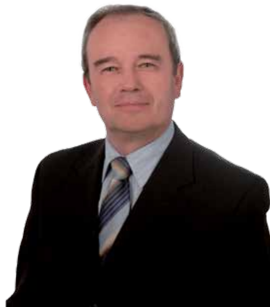
Naročnik: Slovenska ljudska stranka, Beethovnova 4, Ljubljana

Iskreno se vam zahvaljujem za izkazano zaupanje na nedeljskih volitvah, in za glasove, ki ste jih namenili meni osebno kot kandidatu za župana.