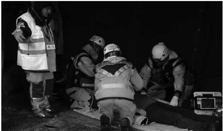
Logaška ekipa nujne medicinske pomoči je reševala tudi gozdarja, ki ga je pičil gad, poleg tega pa je imel akutno vnetje slepiča.

Takoj po petkovem uvodnem sestanku smo iz obveščevalnega centra dobili klic, da je gobarja pičila čebela in da težko diha. Z reševalnim vozilom smo s pomočjo podrobnejšega zemljevida Rogle našli močno prizadetega moškega. Anafilaktična reakcija četrte stopnje ga je tako zdelala, da smo ga po več zapletih komaj rešili. Takoj zatem nas je klicala ženska, ki je v jarku opazila poškodovano vozilo, v katerem naj bi bila ena oseba pri zavesti. Poklicali smo gasilce, ki so ukleščene moškega izrezali, v tem času pa smo izvedli začetno oceno stanja in hitri trauma pregled. Kraj je zavarovala policija. Poškodovanca smo z metodo hitre ekstrikacije odstranili iz avta, ga spet pregledali in oskrbeli ter prepeljali v bolnišnico na oskrbo zlomljene goleni in ostalih poškodb. Na poti nas je ustavil gozdar, ki se je zelo slabo počutil. Ugotovili smo, da ga je pičil gad, imel pa