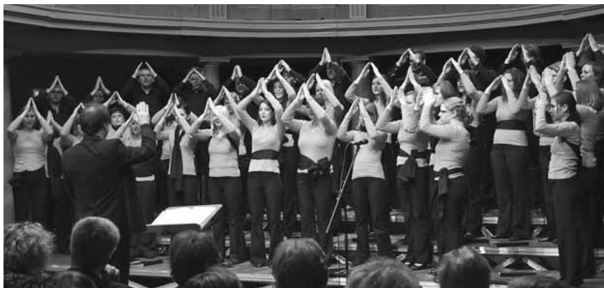
Eno od skladb so pospremili z znakovnim jezikom za gluhe.

M ešani pevski zbor Adoramus je v začetku oktobra gostoval pri prijateljskem univerzitetnem berlinske-mu komornemu zboru. Zapeli so v dveh cerkvah in na festivalu v Neuruppinu pri Berlinu. Tam so pevci ob nemških Madrigalistih iz Weimara in Neuruppinskem A-capella zboru kot gost festivala na Chor Gala koncertu navdušili tako pevke in pevce kot občinstvo, ki je na koncu koncerta v polni dvorani na nogah z bučnim aplavzom pospremilo njihov nastop.