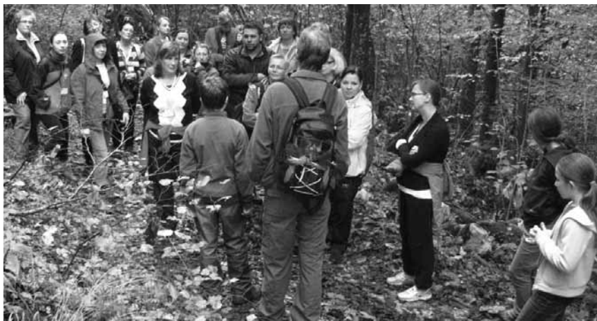
Učitelji iz šestih držav so raziskovali tudi slovenski kras.

OŠ 8 talcev je med 4. in 8. oktobrom organizirala prvo srečanje udeležencev