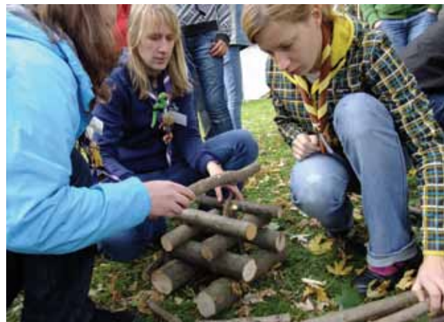
Tekmovalci so morali postaviti tudi simbolni ogenj.