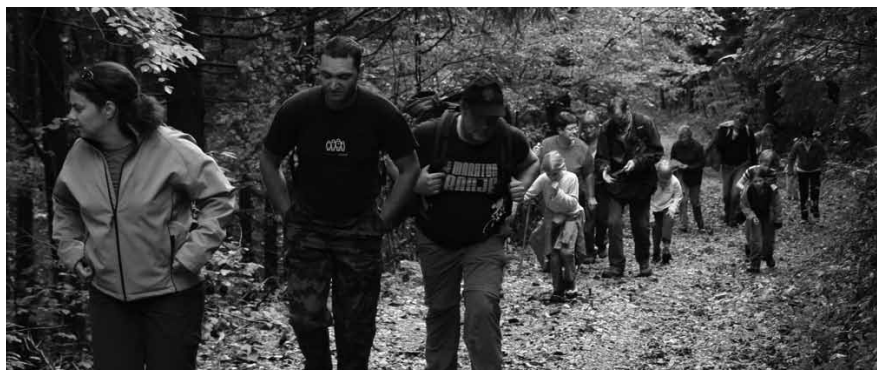
Čeprav zaradi poplavljenega polja niso prišli do Jakovice, so bili pohodniki zadovoljni.