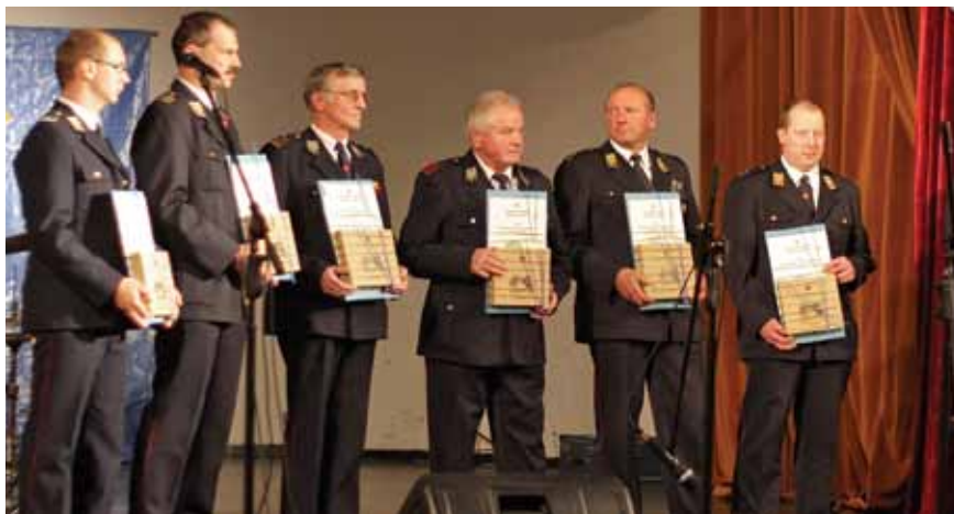
Gasilec se je občina zahvalila s posebnimi priznanji.