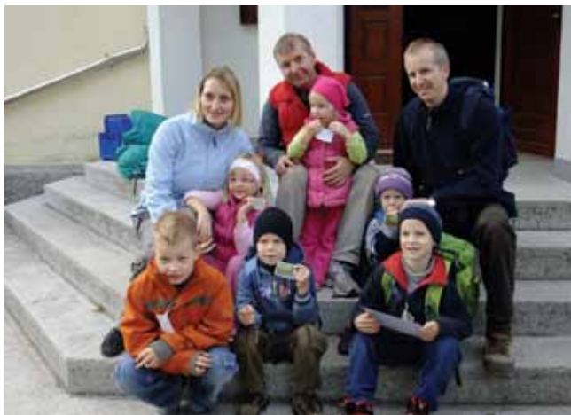
Na pot so se v spremstvu staršev podali tudi najmlajši.