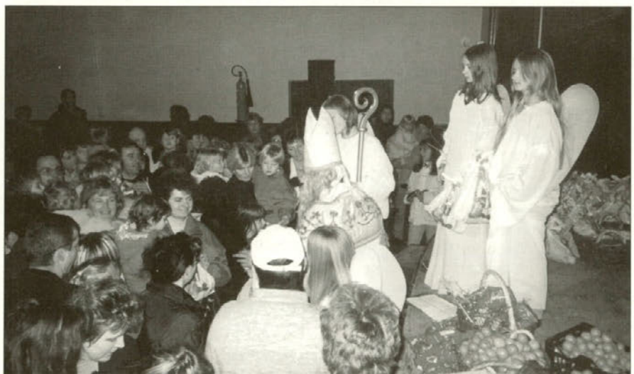
Otroci so se v pričakovanju zbrali okoli svetega Miklavža.