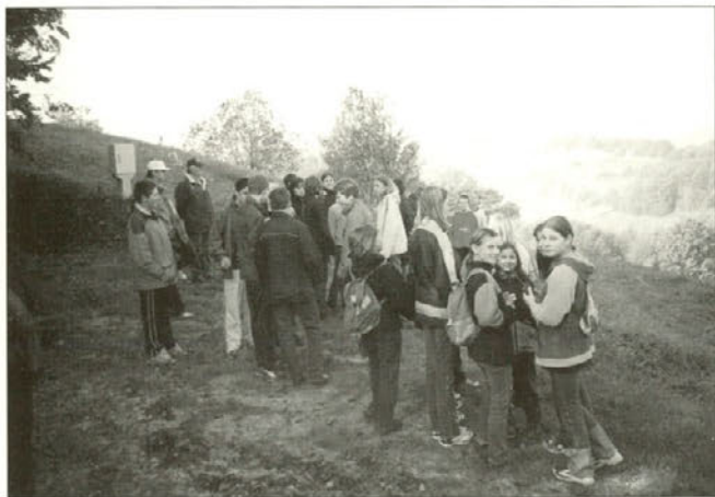
Po strmi poti smo se podali proti repetitorju, kasneje pa tudi proti vrhu Jelovicam.