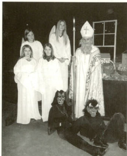
Miklavž s svojimi zvestimi spremljevalci.