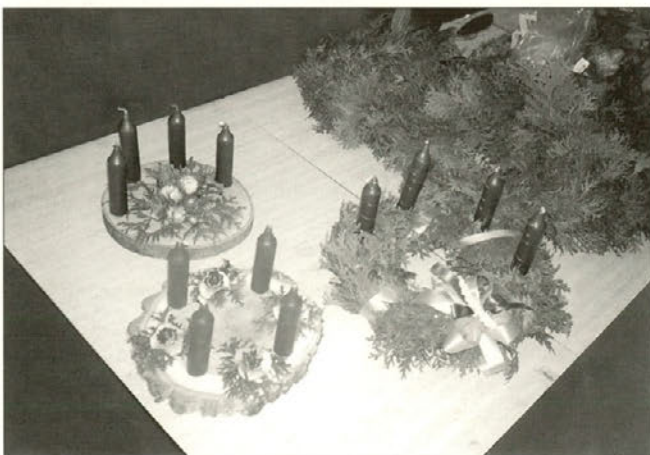
Venčki s srcem.