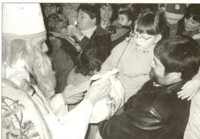
Otroci so sprejemali darila z iskrkami v očeh.