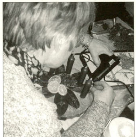
Venčki so nastajali z rokami, z domišljijo in srcem.