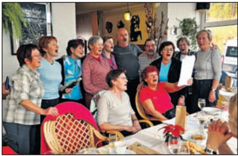
Del priložnostnega pevskega zbora.

Tu so nas razvajali z domačimi dobrotami, pa tudi v nahrbtnikih se je marsikaj našlo. Prostor je pomagalo ogrevati sonce, da smo