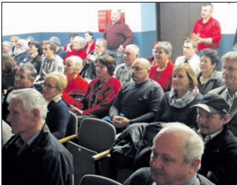
Takšnega števila obiskovalcev slovesnosti niso pričakovali.