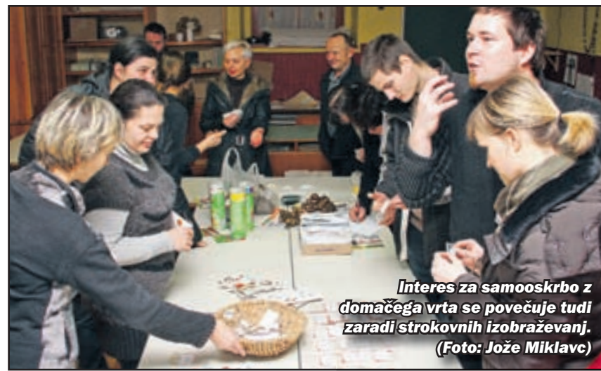
Interes za samooskrbo z domačega vrta se povečuje tudi zaradi strokovnih izobraževanj.