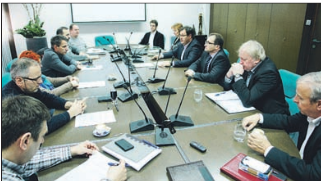
Socialni sporazum za letos so podpisali 15. januarja.