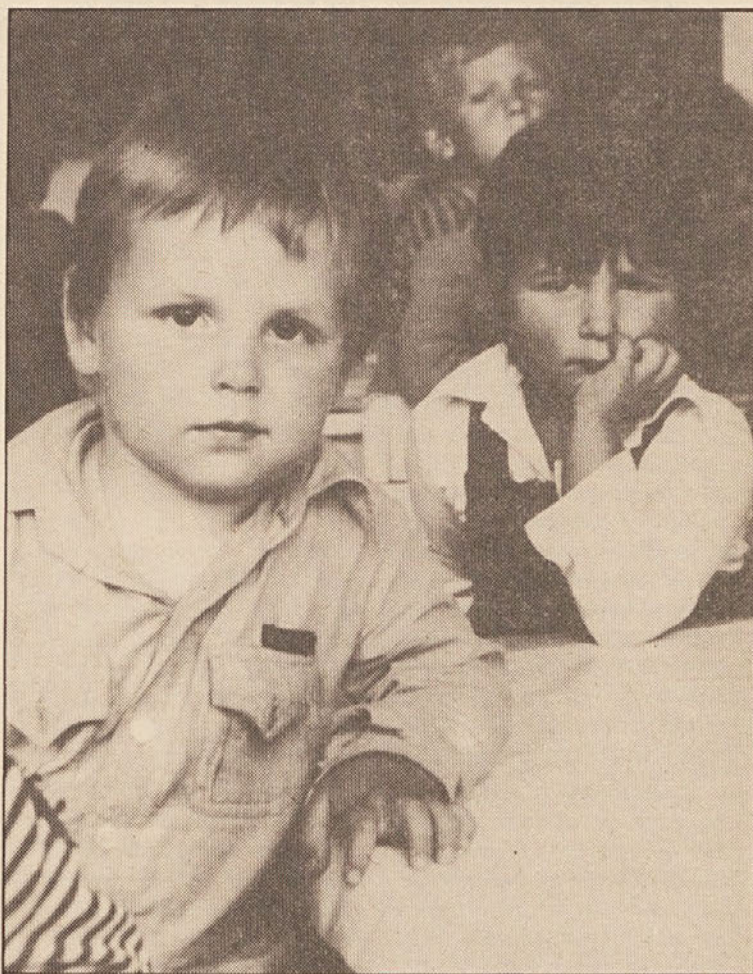
Žalostni in zaskrbljeni pogledi južnokoroških otrok v lastno bodočnost. Naloga nas vseh je, da ščitimo svoje otroke pred Haiderjem in Heimatdienstom.

Kot poroča Evropski svet, naj bi omenjeni na javnem srečanju poročali predvsem o nakanah, po katerih naj bi bili slovensko- in nemškogovoreči otroci razdeljeni. Odbor za kulturne in socialne zadeve se bo posvetoval tudi o zavrnitvi dvojezičnega vrta na Bistrici v Rožu.