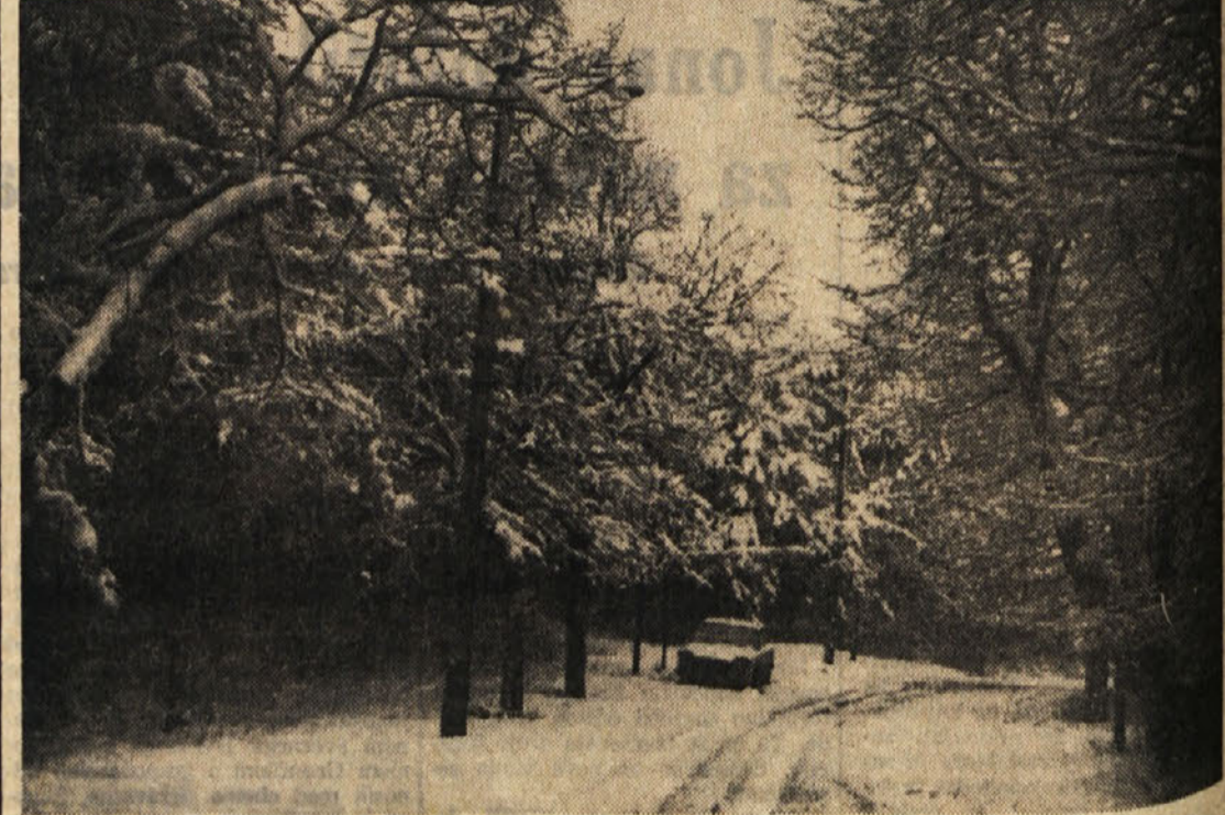
Na Opčinah ...