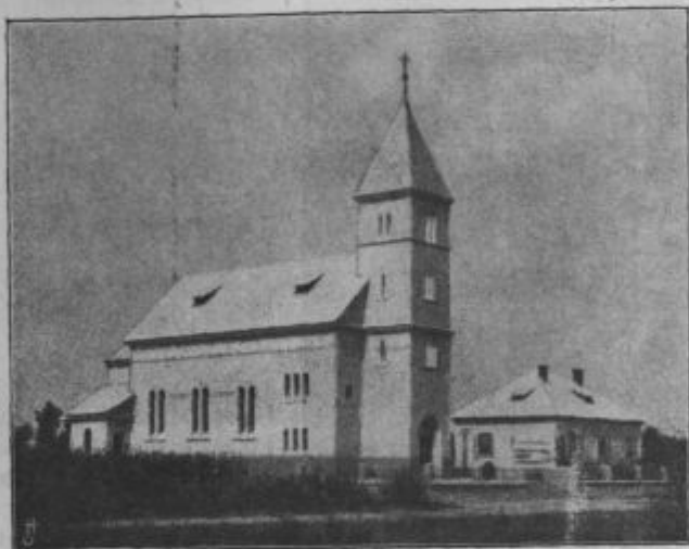
Cerkev Srca Jezušovoga v V. Polani.

Po prečtenji imenovanja za plebanoša i po položenoj prisegi je g. dekan prek dao novomi g. plebanoši ključ od tabernakla, od