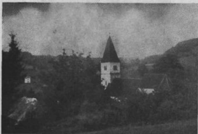
Grad. Cerkev, v šteroj se je vršo sv. misijon.

Z primernimi gorečimi predgami so g. misijonarje segnoli v srca vernikov, te odprli i v nje globoko pa trdno zasadili skrb za rešenje dūše po molitvi, po posvetitvi nedel i svetkov, po spunjavanji boži i cerkvenih zapovedi i po lūbezni dō sladke Mamike, Bl. D. Marije. Kak verno je poslušao dober gorički narod sv. navuke, najbolje jasno posvedoči število svetoga prečiščavanja. Za časa sv. misijonase je prečistilo dvanajset jezero dūš.