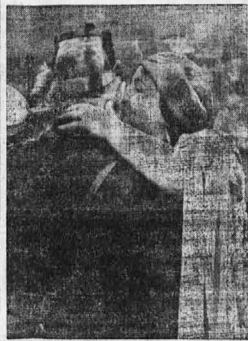
Prijetna zaupljivost do stražnika.

ga, sicer bo ustreljen«, — je Idahio veselo otepal s svojim repom ter je odšel s svojim gospodarjem v določeno kajho. Take sodbe pa v Ameriki niso prereditve. Nedavno je neki slon do smrti pomandral svojega slugo ter je bil za to obsodjen na smrt. Proti justifikaciji ubogega Jumba, ki sodbe ni razumel, pa so dvignila mnoga društva in korporacije tak vihar ogorčenja, da so se prevnetemu sodniku vsi iz srca smejali.