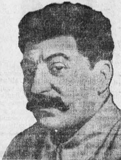
Sovjetski diktator Stalin.

Te dni je pričel pred najvišjim sodiščem v Moskvi proces proti večjemu številu najvidnejših zastopnikov komunističnega režima, ki jih državni tožilec obdoljuje veleizdaje, češ, da so bili v zvezi z neko tujo velesilo in da so delali za odcepitev Ukrajine, Belorusije in nekaterih kavkaških republik od Rusije ter sploh rovarili proti sedanjemu Stalinovemu režimu. Med dru-