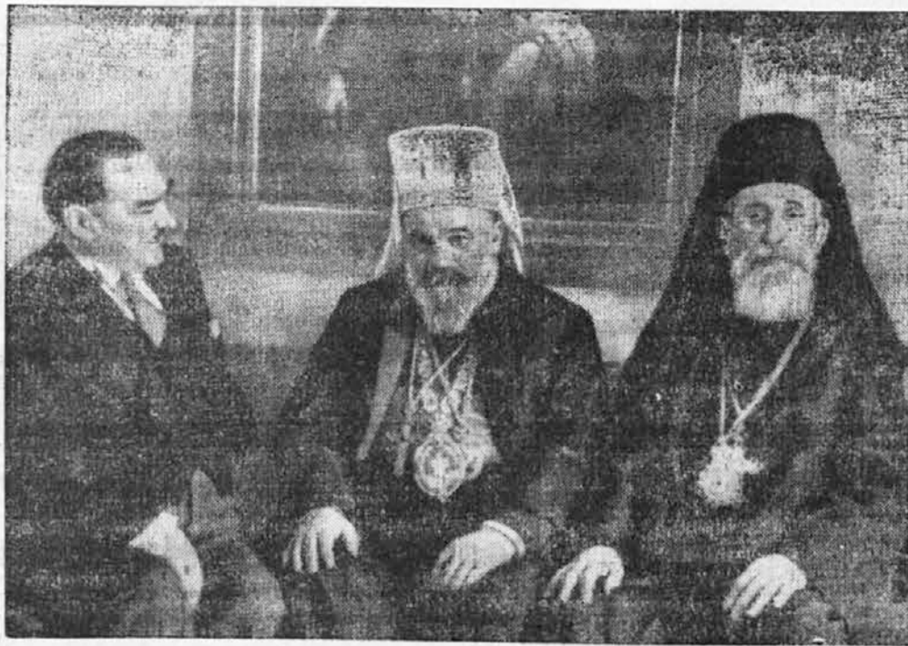
Novi patrijarh srbske pravoslavne cerkve dr. Gavriilo Dožić.