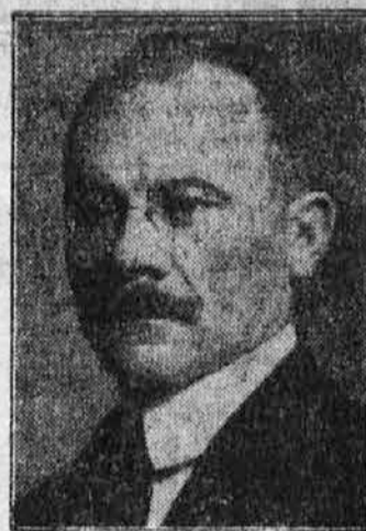
Dr. Milan Hodža.

Velike nade so polagali na Češkoslovaškem na rekonstrukcijo vlade dr. Milana Hodže, in sicer v tem pravcu, da bi vanjo vstopila tudi Hlinkova slovaška ljudska stranka. Te nade pa so se nenadoma izjalovile. Izkazalo se je, da Hlinkove napovedi glede letošnje slovaške propagandne ofenzive z ozirom na znano pittsbursko pogodbo niso bile zgolj napovedi.