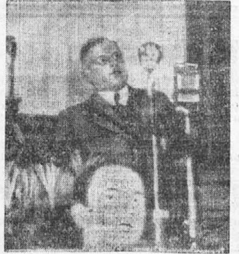
Dr. Schuschnigg govori...

V sosednji Avstriji so preživeli zadnje 14 dni nekaj burnih notranje-političnih dogodkov, ki jih je treba gledati v luči berchensgadenskega reflektorja. Po govoru, ki ga je 20. pr. m. v nemškem državnem zboru imel kancelar Hitler, je bilo za vsakogar jasno, da bo odgovoril nanj tudi avstrijski zvezni kancelar dr. Schuschnigg. To se je zgodilo dne 24. preteklega meseca in so prvič prenašali tudi po nemškem radiu govor avstrijskega državnika. Dr. Schuschnigg je v skoraj triurnem govoru rotil vse pozitivne sile naroda, naj se str-