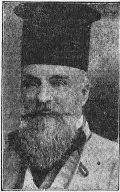
Predsednik romunske vlade patrijarh Miron Christea.

Po prvih strogih ukrepih, ki jih je izdala nova diktatorska vlada v Romuniji, je najvažnejše vprašanje nove ustave. Ustava, ki je bila pred kratkim sprejeta, določa, da bo zakonodajno delo vršil sam kralj po narodnem predstavništvu, ki ga bosta tvorila poslan-