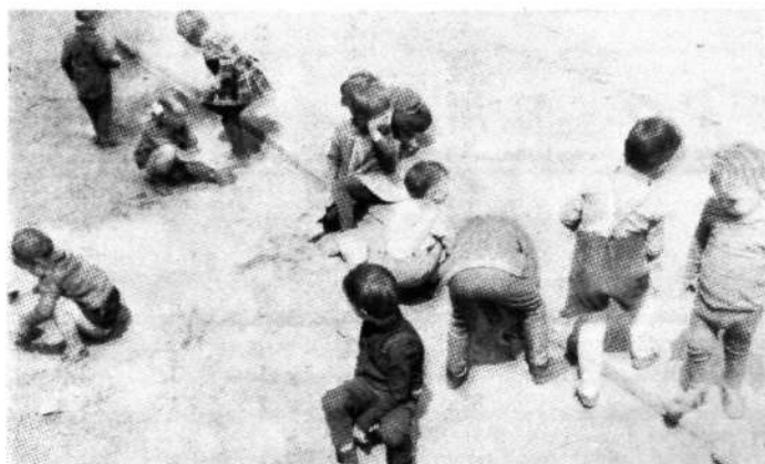
Otroci vzgojnovarstvene ustanove Novi svet pri igri

Z modernizacijo vzgojno-izobraževalnega dela in učnih sredstev s preurejenimi učnimi načrti, ki bodo izločili nepotrebne zgodovinske podatke, z ures-