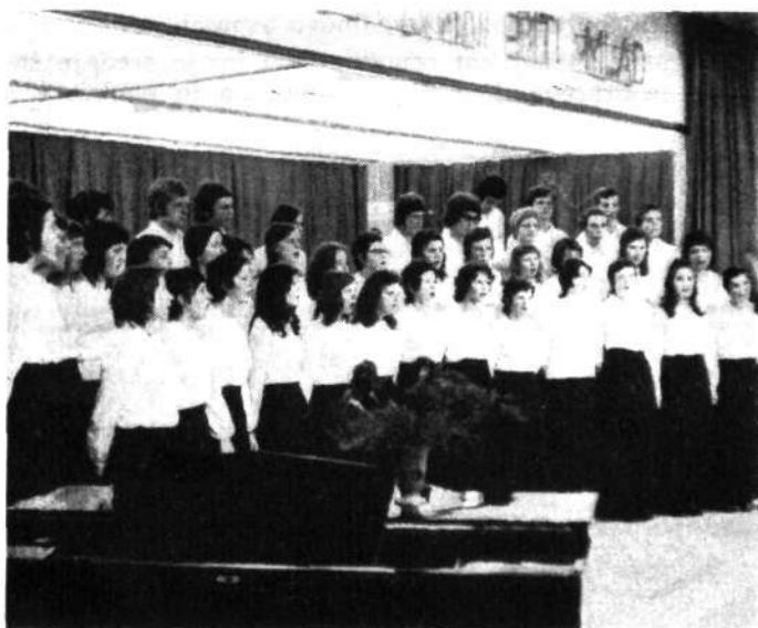
Mešani pevski zbor gimnazije v Škofji Loki

Popolna gimnazija v Škofji Loki obstaja od leta 1954. V njej pridobivajo učenci pretežno temeljno znanje za nadaljnji študij na višjih in visokih šolah. Le redki učenci se po končani gimnaziji zaposlijo. Šolanje na gimnaziji nadaljuje približno 20 % tistih učencev, ki nadaljujejo šolanje po obvezni osnovni šoli. Odstotek se približuje potrebam po kadrih z visoko ali višjo izobrazbo in tudi ustreza širokim možnostim, ki jih imajo učenci za šolanje na srednji stopnji, zaradi vedno bolj razvejanega strokovnega šolstva.