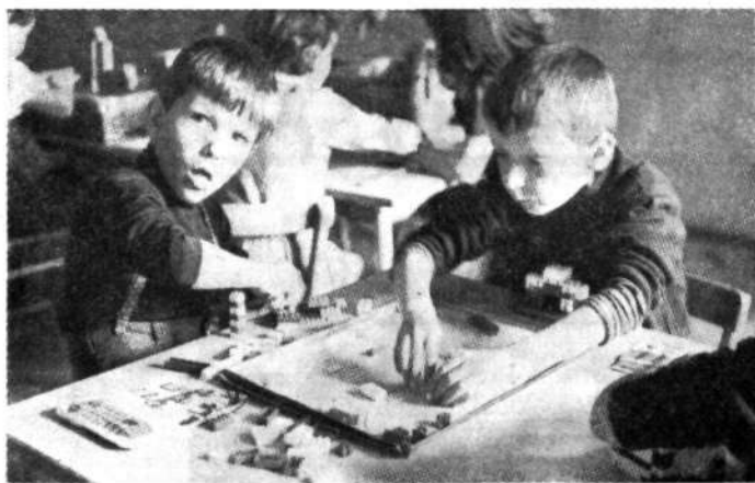
Učenci posebne šole pri delu

Bistveno drugačni značaj kot osnovne šole imajo srednje šole. Osnovna šola ima splošno izobraževalni značaj, je obvezna in enotna v svojem vse-