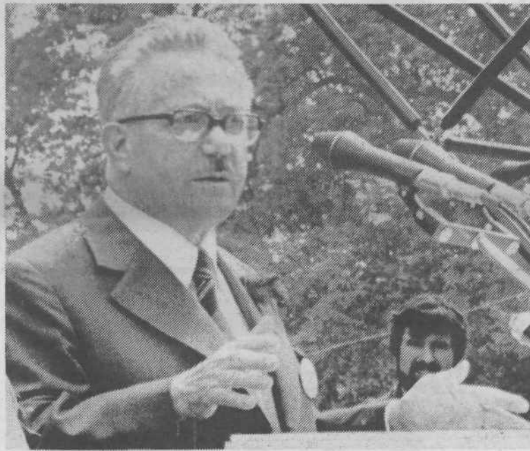
KLENA PRODORNOST – Naši marksistični misli mora biti tuje capljanje na mestu, v okornih dogmah, v subjektivističnih konstrukcijah, v navadah in pragmatizmu.

Toda že takrat smo naleteli na hude ovire, deloma zaradi objektivnih težav kot tudi zaradi zavestnih ali podzavestnih odporov že v precejšnji meri zbirokratizirane tehnostrukture proizvodnje v naši družbi. Zato je bilo potrebno, da se vodstvo Zveze komunistov in zvezna vlada odločnejše angažirata v spopadu s temi odpori. To je bilo storjeno s