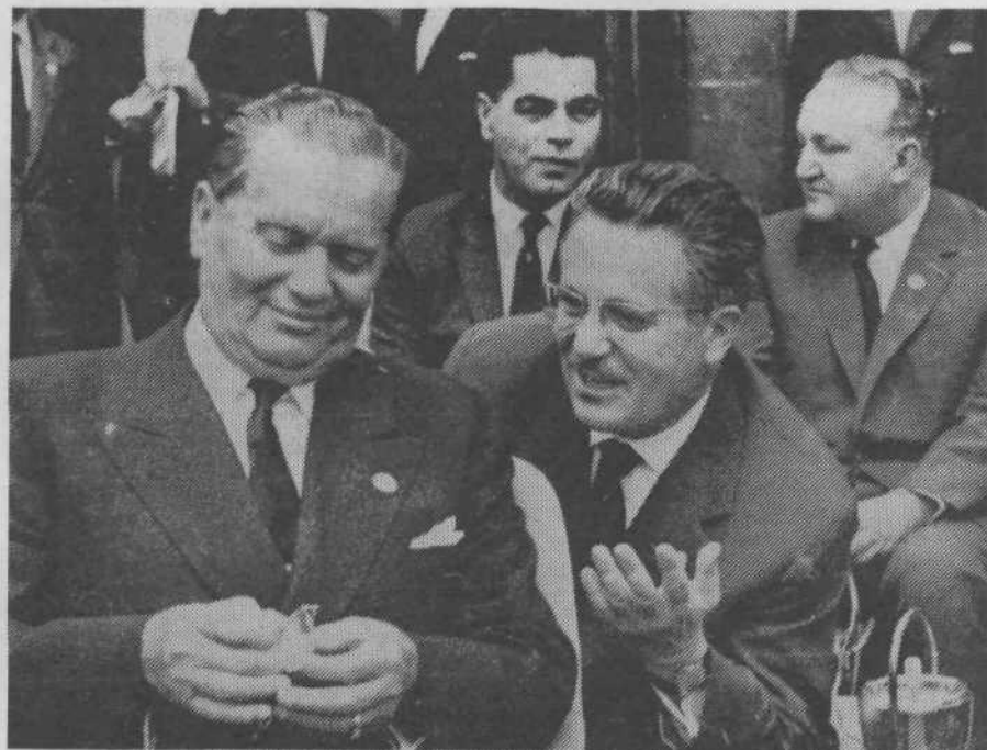
Tito in Kardelj na 1. konferenci nevrščenih držav v Beogradu leta 1961. V ozadju Veljko Vlahović in Vladimir Bakarić.

navodila za delo ne glede na to, koliko je bilo vse to realno ali ne. Dejansko so frakcijski boji v Partiji, dolgotrajno bivanje v zamejstvu brez zveze s konkretnimi problemi v deželi kakor tudi dejstvo, da so začele metode kominterne v sodelovanju s posameznimi kompartijami kazati številna znamenja birokratizma in shematizma, povzročili, da so