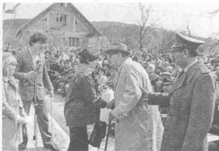
– Mali pionirji iz osnovne šole v Robu so ob zaobljubi prvemu komandantu slovenskih partizanskih enot in prebiranju pisma slovenskih pionirjev predali kuričkovo pošto Francu Leskošku-Luki, ki jo je nato vročil pionirjem s Turjaka, le-ti pa so jo ponesli naprej.