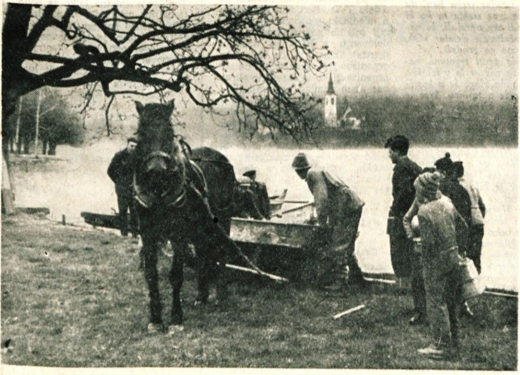
BLEJSKA RAZGLEDNICA: Zima se bliža