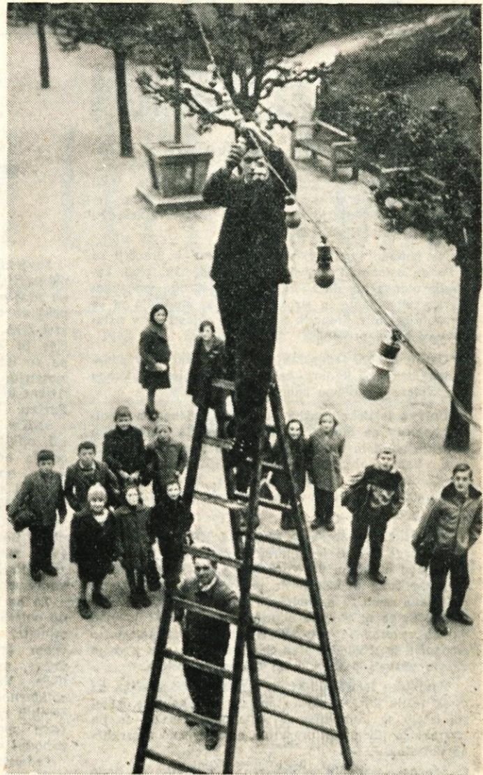
Park »Svobode« v Kranju že nekaj dni preurejajo — Otroci pa so nestrpni, ker bi se že radi pogovorili z Dedkom mrazom

V prihodnje bo treba iz sredstev za negospodarske investicije oddvojiti tudi večji del za ureditev