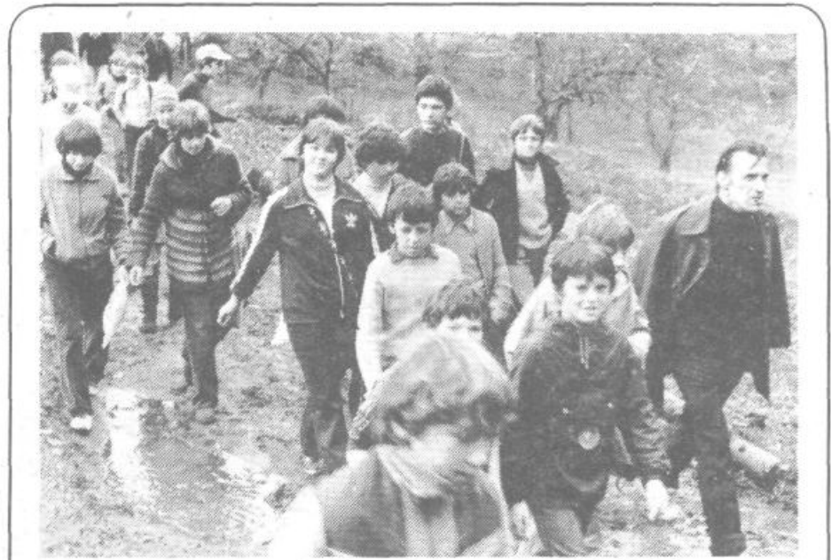
Trimski pohod na Igu privabi mlajše in starejše ljubitelje hoje

2. Starejši pionirji (rojeni 1966) in starejše pio-