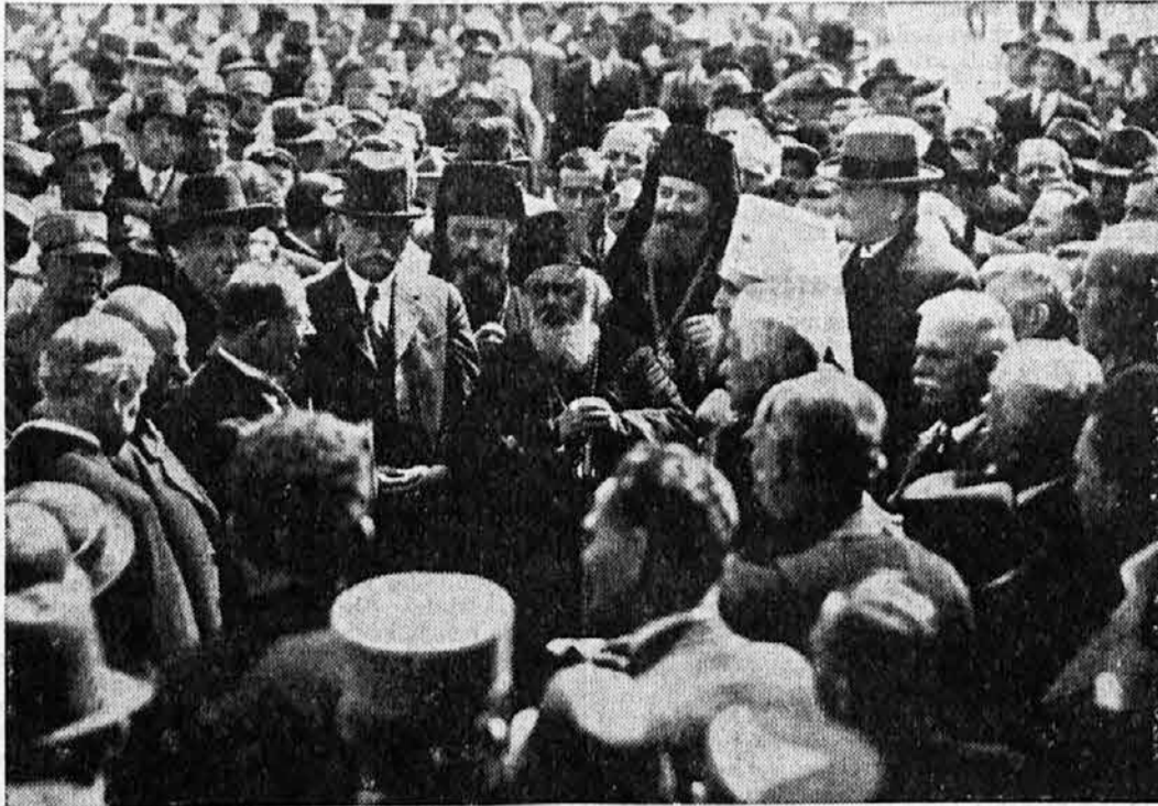
Slika s proslave osvoboditve Skoplja. V sredi patriarh srbske pravoslavne cerkve Varnava, ki je danes ponoči umrl

Včeraj so tudi odprli Marconijevo oporoko, ki jo je pokojnik že davno prej izročil notarju v veliki kuverti, zapečateni s petimi velikimi pečati. Navzoči so bili pri tem sorodniki. Oporoka ima strogo osebni značaj in se nanaša le na ožje sorodnike.