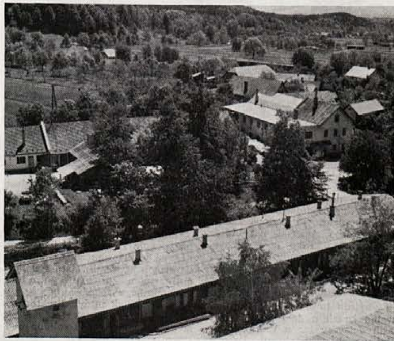
Stare lesene barake — upravne zgradbe in skladišča ni več. Staro se menja z novim, sodobnejšim