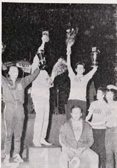
Ob razglasitvi rezultatov

je padlo 514 borcev, 570 prebivalcev pa je zgubilo življenje kot talci, v internaciji ali ob bombardiranju. Občina Cerknica ima 7 narodnih herojev.