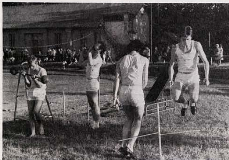
Trim, trim, trim