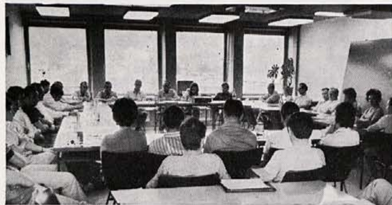
Seja delavskega sveta

Od konstituantne dne 2. 6. 1970 je delavski svet imel 16 sej. Udeležba ni bila vedno zadovoljiva, saj je znašala povprečna le 65,4%. Opravičeno ali neopravičeno so v glavnem izostajali vedno eni in isti člani zaradi službene odsotnosti ali obiskovanja šole, veliko pa je bilo tudi primerov, ko člani niso mogli menjati delovne izmene, kljub posebnemu sklepu DS.