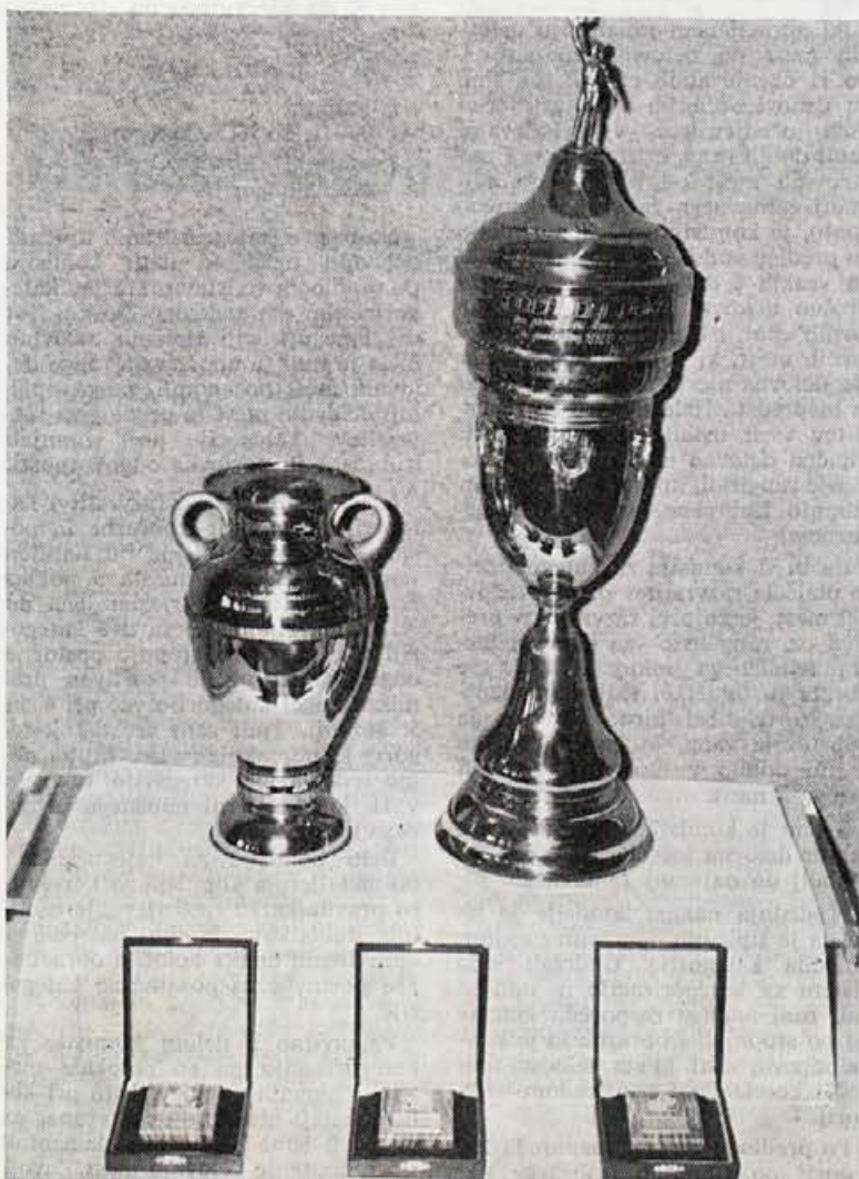
Naš izkupček iz Lesariade 72. — Poročilo glejte na 5. strani

Odbor za vprašanje združenega dela ima 5 članov in 3 namestnike. Predsednik odbora je tov. Jerala Vinko.