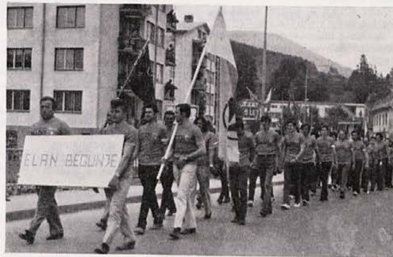
Naši športniki v paradi na III. lesariadi 72

SAH ŽENSKO: Med 9 ekipami je 4. mesto za naše šahistke odličen uspeh. Samo točka več, pa bi bile lahko druge.