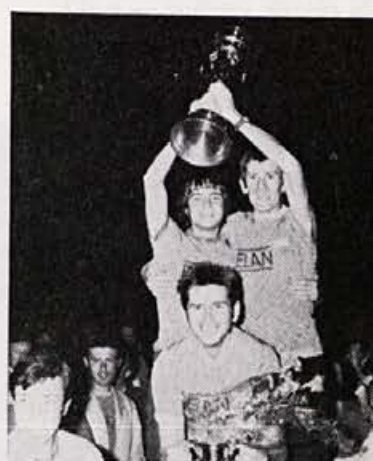
Najuspešnejši in — naj srečnejši

KEGLJANJE MOSKI: 5. mesto med 30 ekipami ni kar tako, vendar naši kegljači niso izpolnili pričakovanja. Bili so vsekakor favoriti v tej disciplini. Bo pa drugič bolje! Med prvo uvrščeno ekipo Bresta in našo na petem mestu je bilo le 14 kegljev razlike.