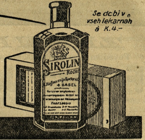
Se dabi v vseh lekarnah à K. 4.-