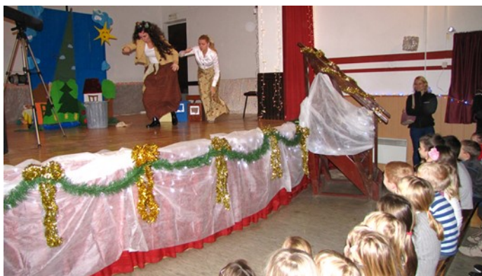
Otroci pozorno spremljajo predstavo.

V nedeljo, 18. 12. 2016, je na Lavrici iz otroških grl zadonel »dedeeek Mraaaaz«. Polna dvorana otrok s starši je nestrpno pričakovala tega dobrega moža. Najprej se je odgrnila zavesa v dvorani in pred otroškimi očmi so se razkrile zanimive kulise, ki so napovedale predstavo Pravljica o dveh vaseh. Zgodba se odvija na deželi, kjer stoji na eni strani hriba s soncem obsijana vasica z bujnimi zelenimi drevesnimi krošnjami, pisanimi cveticami v parku ter z lepimi hišami in čistimi ulicami. Na drugi strani hriba stoji zanemarjena vas, s suhimi drevesi v parku in smetmi na vrtovih. In pride dan, ko v tej vasici ni prostora niti za eno smet več. Zato se vaščani odločijo, da bodo odpadke odlagali v sosednji, lepo urejeni vasi. Ko se naslednje jutro prebivalci lepe vasi prebudijo, opazijo kupe smeti in se takoj lotijo pospravljanja. Enako dan za dnev, dokler jim ne prekipi in se odločijo, da bodo obiskali svoje sosede ter jim pokazali, kako se z odpadki pravilno ravna. Prebivalci zanemarjene vasi se na koncu zgodbe naučijo pravilnega ravnanja z odpadki in s tem prispevajo k ohranjanju okolja.