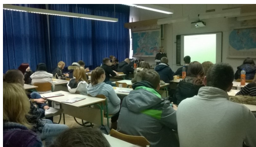
Delavnica v Trbovljah.

Septembra 2016 smo, ob finančni podpori Zavarovalnice Triglav, skupaj z Novo ljubljansko banko, začeli izvajati projekt »Finance za mlade«, katerega namen je finančno opismenjevanje mladih: kdaj smo finančno samostojni, kako izgledajo finance za 5, kako varčujem in kakšna varčevanja obstajajo, kdaj se odločim za kredit in podobno. Delavnica »Finance za mlade« je namenjena srednješolskim otrokom. Na ta način znova vzpostavljamo vez s populacijo mladih, ki nam še vedno polzi med prstmi.