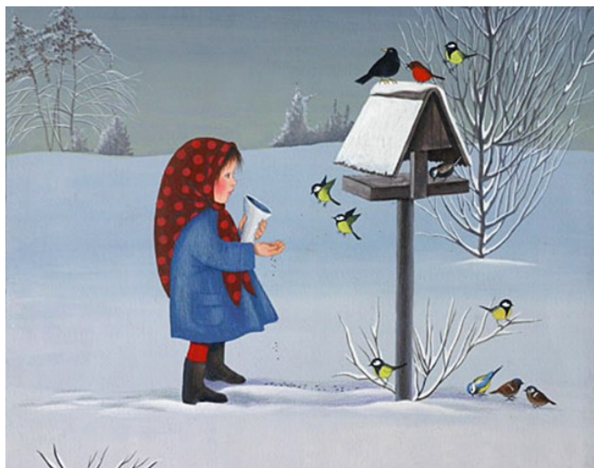
Ilustracija: Jelka Reichman

Tisoče in tisoče puhastih, kot dih nežnih, in lahnih poljubčkov se je mehko dotikalo hiš in dreves, travnikov in poti. In sipalo na zemljo čisto srečo.