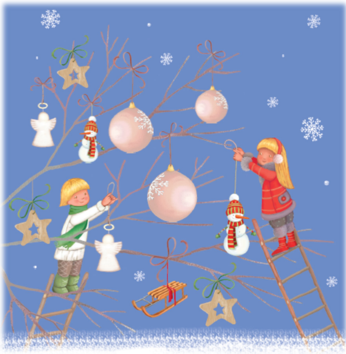
Ilustracija: Alenka Vuk Trotovšek