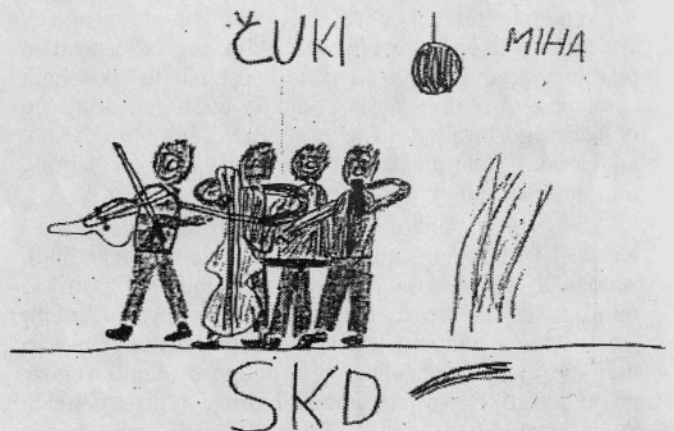
TAKO 6-LETNI OTROK VIDI NASTOP ČUKOV V TRŽIČU

Sprejet je bil še Odlok o moratoriju za gradnjo na Lajbu v Podljubelju s smislom, da se na začetih delih ne nadaljuje.