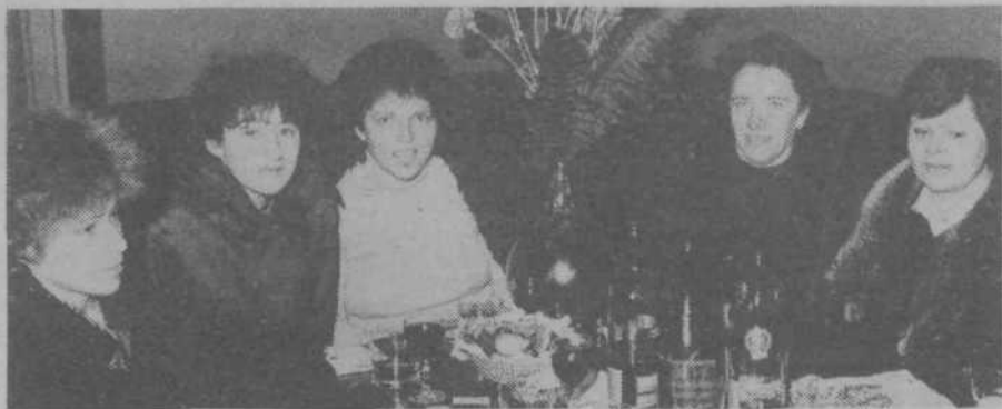
O srečanju z Bežigradčankami ob dnevu žena v prijetnem lokalni Vija - Vaja berite na strani 2.