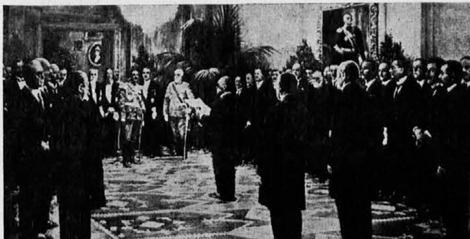
Nj. Vis. Regent Aleksandar prima izaslanstvo Nar. Vijeća Slovenaca, Hrvata i Srba, iz Zagreba, 1 decembra 1918. (Prema slici I. Tišova)

(Odluka Podgoričke Skupštine od 26 novembra 1918)