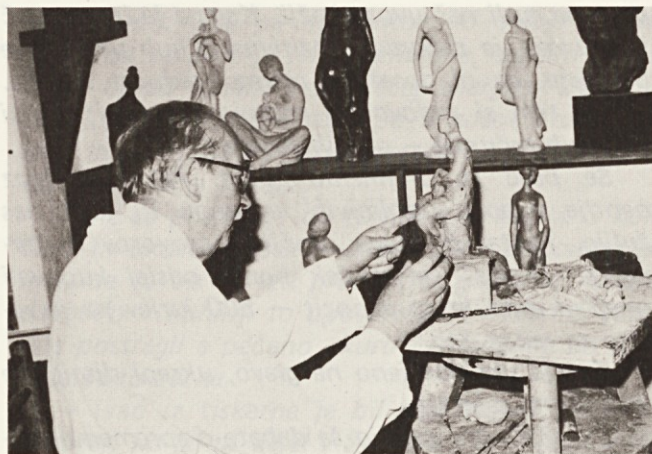
Umetnik pri delu

Pripravlja se delovni koledar za leto 1983. Ne zadovoljni smo „torkarji“, zaradi velikega števila delovnih sobor, seve.