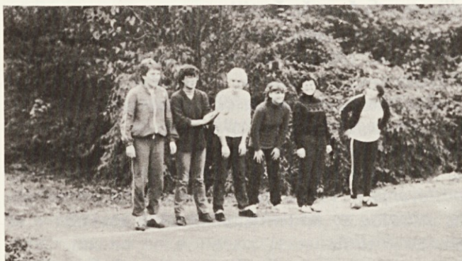
Svilanitove odbojkašice — neporočene

Za las nam uide pokal na tradicionalnem športnem srečanju — troboju.