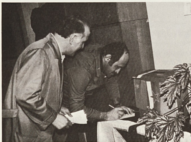
Kmalu bomo volili