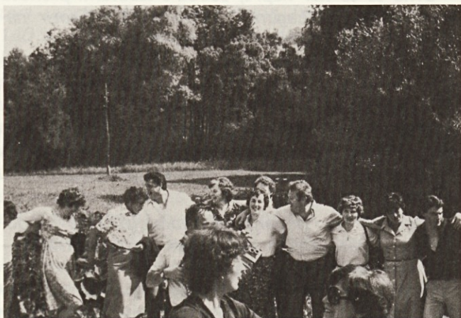
Mi se imamo radi . . .

Junij je poln kulturnih utrinkov: Večer pesmi, plesov in melodij, srečanje pevskih zborov društev