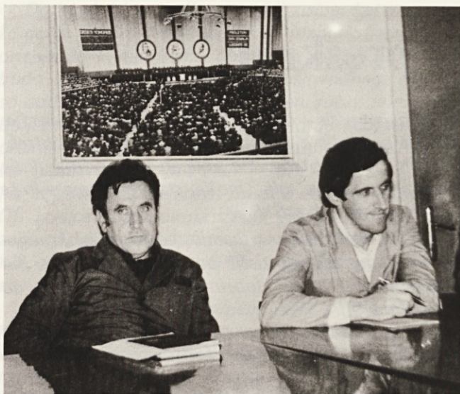
Tokrat: milo za drago

Zaradi takih in podobnih nezdoljivosti ima mnogo rajši svoje pohode v naravo s kamero v roki. Sploh pa odkar ima nov, moderen japonski aparat. Posnetek se naredi zelo hitro, zanj so potrebne le stotinke sekunde. Do fotografije pa je potem še dolga pot. Njena kvaliteta je v veliki meri odvisna od kasnejše obdelave filma. Delo v temnici je zamudno, zato se mu lahko več posveti le pozimi. Takrat se za več ur zapre v temnico in dela v popolni temi ali pri skrivnostni rdeči ali zeleni razsvetljavi. Ves trud pa je poplačan, če kakšen posnetek uspe, to pomeni, da je motiv posnet s pravilnega kota in razdalje, ob pravilni razsvetljavi in v ravno pravilnem časovnem razdobju.