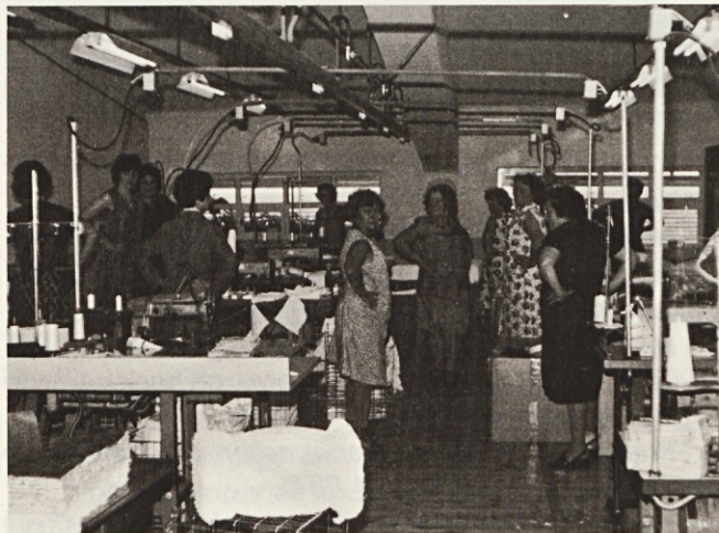
1—2—3—4: tudi na drobnih izdelkih

Gradnja gasilske šrambe se prične. Ve se, kdo je tega najbolj vesel.