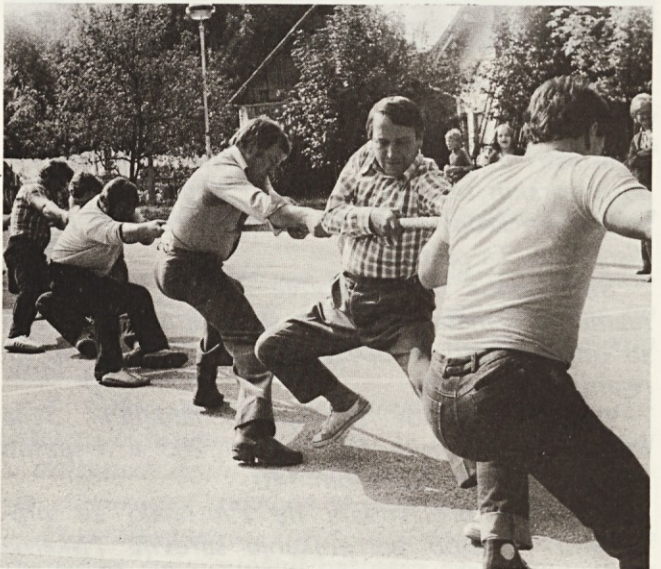
Tone je na vso moč vlekkel tudi „rdečo nit“

Sodelujemo na zaključni prireditvi sindikalnih iger. Tretje mesto na Igrah brez meja nas zadovolji.