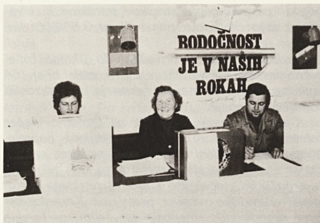
Komentar je odveč . . .

resne skupnosti in samoupravne organe v delovni organizaciji. Visoka številka nas zmede, vsak četrti Svilanitovec pa je delegat.