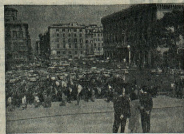
Trg Venezia v Rimu

Odpotovali smo ob 22,34 uri. Lepo smo se porazvrstili v spalne vozove in že smo krenili na dolgo pot, kajti prihod v Rim je bil predviden ob 7,23 uri, t. j. približno 9 ur sicer prijazne vožnje, ker