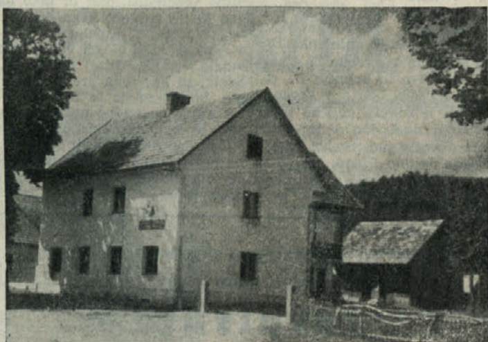
V stavbi, kjer so sedaj uradi Gozdne uprave v Grčaricah, je bila septembra 1943. leta glavna postojanka plavogardistov, ki so jih partizani v hudi tridnevni bitki premagali

PRICUJOČI ODLOMEK POVZEMA MAMAM IZ TETRALOGIJE (ROMANA V ŠTIRIH KNJIGAH) »ZA SVETLIMI OBZORJI«, KI GA JE NAPISAL ZNANI SLOVENSKE KNJIŽEVNIK MIŠKO KRANJEC. V TEM OBSIRNEM DELU PISATELJ OPISUJE ZGODOVINO SLAVNE XIV. DIVIZIJE IN NJENO ZMAGOVITO POT NA ŠTARSKO, V PRVEM DELU, OD KODER JE ODLOMEK, OPISUJE TUDI BOROBO S PLAGOGARDISTI V GRČARICAH IN NJIHOVO UNIČENJE.