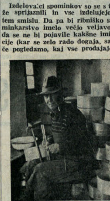
Izdelovalec suhe robe doma

Obrazložil je tudi delo podružnic krajevnih odborov Socialistične zveze. Po statutu SZDLJ je mogoče ustanovljati tudi podružnice krajevnih organizacij. Te naj bi ustanovljali tam, kjer bo organizacija teritorialno velika z velikim številom članov. Podružnice bodo opravljale samo organizacijsko-tehnične naloge (pobiranje članarine, evidenca članstva in podobno). Govoril je tudi o pomanjkanju prostorov za organizacije SZDL. Brez urejenih prostorov je delo organizacij zelo oteženo, zato je prostor tudi zelo važen pogoj, da bo delo krajevnih organizacij Socialistične zveze steklo in doseglo uspehe. —zem