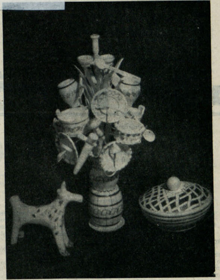
ZNAMENITI, UMETNIŠKO IZDELANI RIBNIŠKI SOPEK (Na drugi strani preberite reportažo o ribniških suhorobarjih in spominkarstvu!)