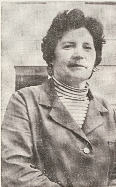
Zaposlena 35 let

Doma je iz Ponikve pri Grobelnem, rojena pa 13. 12. 1931. S šestnajstim letom si je poiskala službo tu v Laškem, v tekstilni tovarni, kjer je še sedaj zaposlena. Najprej je delala v predilnici, nato v tkalnici, sedaj pa je zaposlena na delovnem mestu previjalke preje v predilnici II.