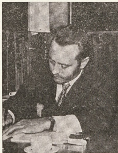
27 let v Dekorativni

»Pred leti so nam največ težav v pripravljavnici povzročali stari stroji. Tu mislim predvsem na navijanje preden. Z modernizacijo ostalih oddelkov, predvsem barvarne, se je moral spremeniti tudi strojni park v pripravljavnici.«