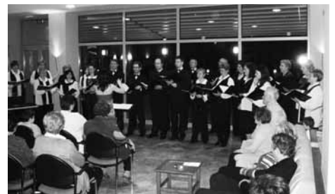
Koncert ob kulturnem prazniku