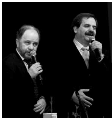
Če Marela ni za na televizijo, je pa urednik prišel na Marelo.