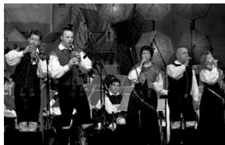
Stoparji v prvi zasedbi z odličnimi pevci