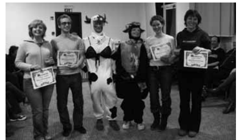
Novi pevci so prestali »krst«.

Vsako leto pridobimo nekaj novih pevcev, ki jih je potrebno krstiti. Seveda se mora »zelenjava« (kot jih v šali imenujemo) pomeriti v nalogah, ki jim jih zastavi stroga komisija. Če vse naloge uspešno opravijo in na koncu dajo še posebno zaobljubo, da bodo redno hodili na vaje, prejmejo »sprejemni list« in postanejo člani zbor.