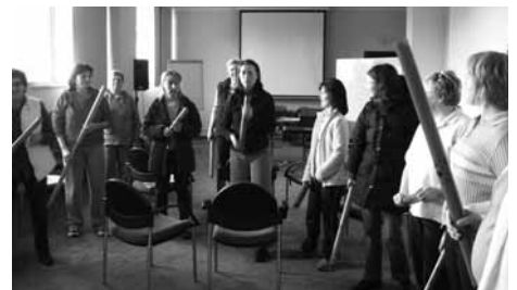
Novi, zanimivi instrumenti