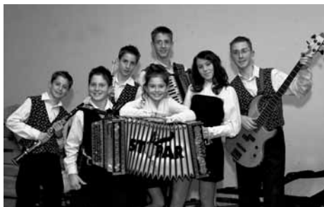
Stoparčki, novi upi na slovenski narodno-zabavni sceni