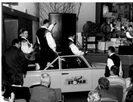
Stoparji so se pripeljali kar z avtom!