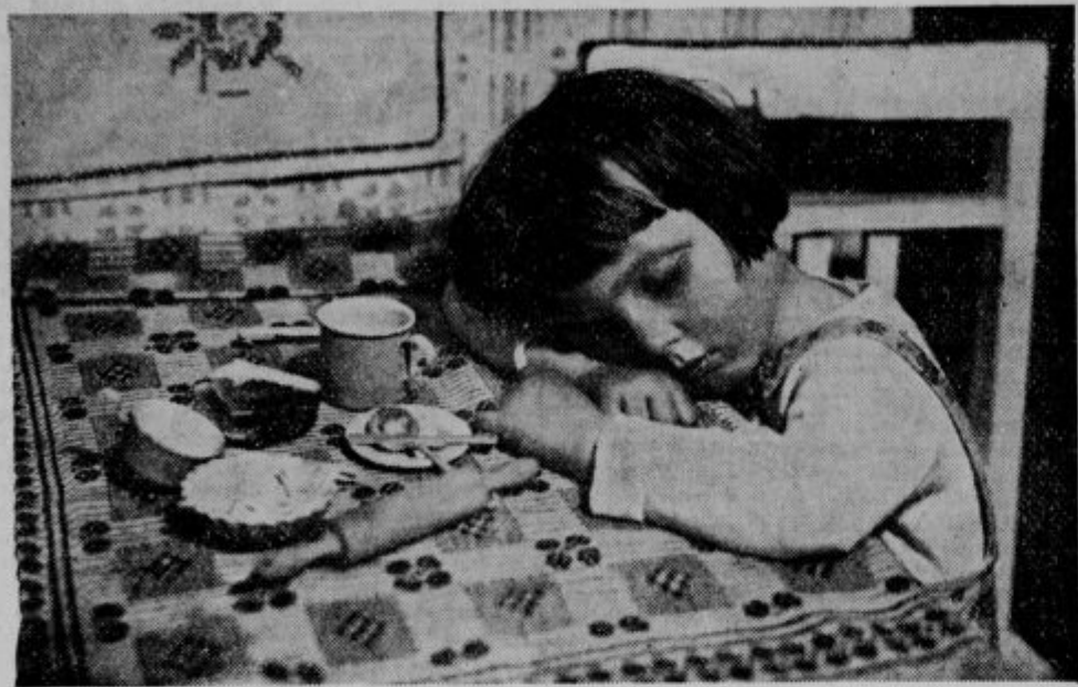
S fotografske razstave.

Prav blizu nje pa čisto slučajno visi posnetek lepe ženske glave od F. R. Hudnika. Ta fotografija je kakor nežna pesem, katere se komaj še dotika resničnega življenja. Toliko nežnosti prav malo vidiš v portretni fotografiji. Škoda, da druga Hudnikova dela tako zaostajajo.