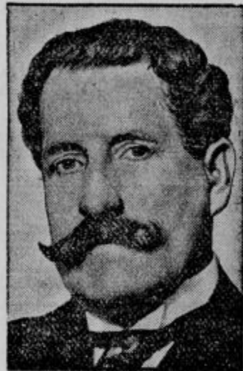
Filip Berthelot, dolgoletni Briandov sotrudenik v zunanem ministrtvu in duša francoske zunanje politike, je nevarno obolel. Zdravniki nimajo upanja, da bi okreval.