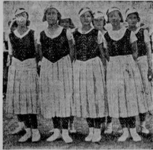
Kdo bi mislil, da so to Turkinje! In sicer so to sportašice iz dežele Kemala paše.

Današnji pomehkuženi svet trdi, da so otroci, ki izhajajo iz družin s številno dečo zanič in življenja nezmožni. Preiskava je dokazala nasprotno. Neki škot je na vprašanje velikega angleškega lista poslal seznam svojih enajstih bratov in sester, izmed katerih je on najstarejši. Ti so stari 74, 72, 70, 69, 67, 65, 63, 60, 58, 56, 52 in 50. Skupna starost vseh je 682 let. Neki A. B. piše, da je on najmlajši izmed osmih živčih bratov, ki so stari: 80, 78, 76, 74, 72, 67, 65 in 61. Skupaj 573 let. »Lizika« piše, da ima njen oče devet bratov in sester: 77, 76, 74, 72, 70, 68, 66, 62, 59 in 56, skupno 680 let.