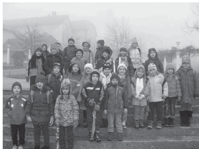
Učenci v šoli v naravi