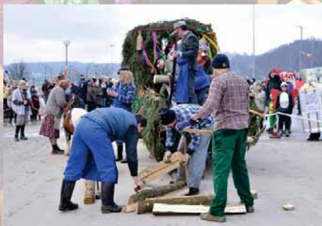
Zmagovalni Drvarji iz Preše