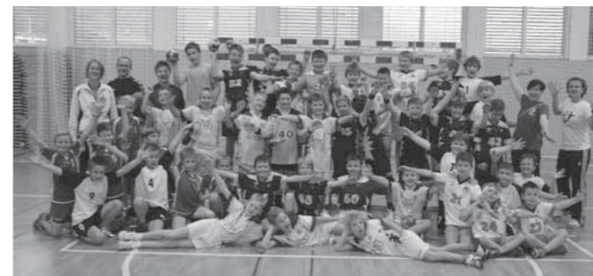
Na sliki sodelujoči v Majšperku: OŠ Mladika, OŠ Olge Meglič, OŠ Ljudski vrt in OŠ Majšperk dve ekipi.