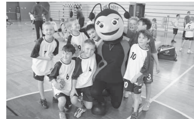
Majšperčani z maskoto

Hrvaške in Slovenije. Pokrovitelj je nagradil vse sodelujoče z nagradami, medaljami in pokali. Občutki po srečanju pa so opravičili moto: »Sreča za majhne in velike«.