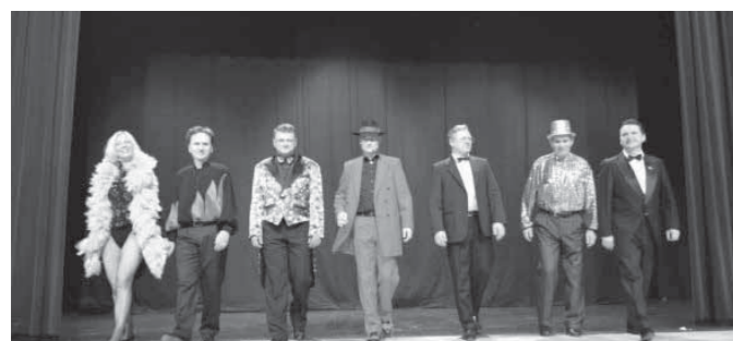
Nastopajoči na magičnem večeru