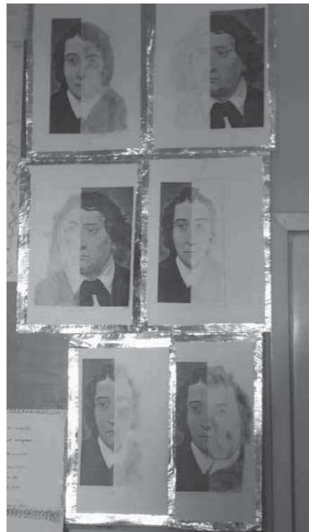
Plakat o Prešernu