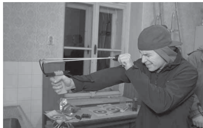
»Fračar« v akciji

V soboto, 6. 12. 2014, je Turistično društvo Naraplje organiziralo tekmovanje v streljanju s fračo, ki je bil tudi zadnji dogodek v športni ligi TD Naraplje 2014. Zaradi dežja smo strelišče uredili v prostorih OŠ Naraplje. Tekmovanja se je udeležilo 17 tekmovalcev in tekmovalk, ki so se trudili čim bolj natančno zadeti tarče na razdalji desetih metrov.