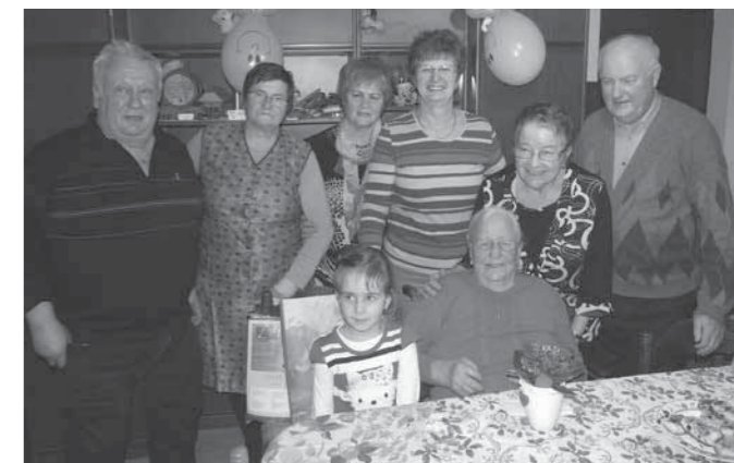
Zbrani ob slavljenki