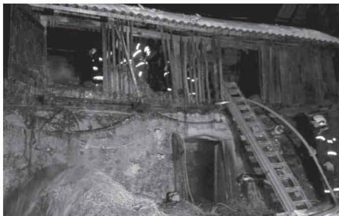
Požar v Stopercah

V prejšnji številki Majšperčana sem poudaril, kako naporno in zahtevno je bilo leto 2014 za nas, gasilce, na področju posredovanj in intervencij in zaključil z željo in upanjem, da bi bili praznični decembrski dnevi mirnejši in brez nesreč. Vendar ni bilo tako. V decembru smo intervenirali 3-krat. Najbolj