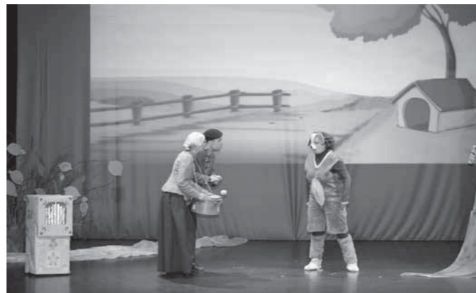
Dedek in babica s kužkom Postružkom

»Predstava mi je bila zelo všeč, ker so odigrali odrasli in otroci skupaj. Najbolj sta mi bila všeč kužek Postružek in ptiček Kraljiček. Kostumi so bili zelo spretno in lepo narejeni. Osvetljava mi je bila zelo všeč, ker ni bilo vse osvetljeno z eno barvo, ampak z več barvami. Zelo mi je bilo všeč, ker je bila v ozadju tudi projekcija. Zelo lepo in domiselno je bilo