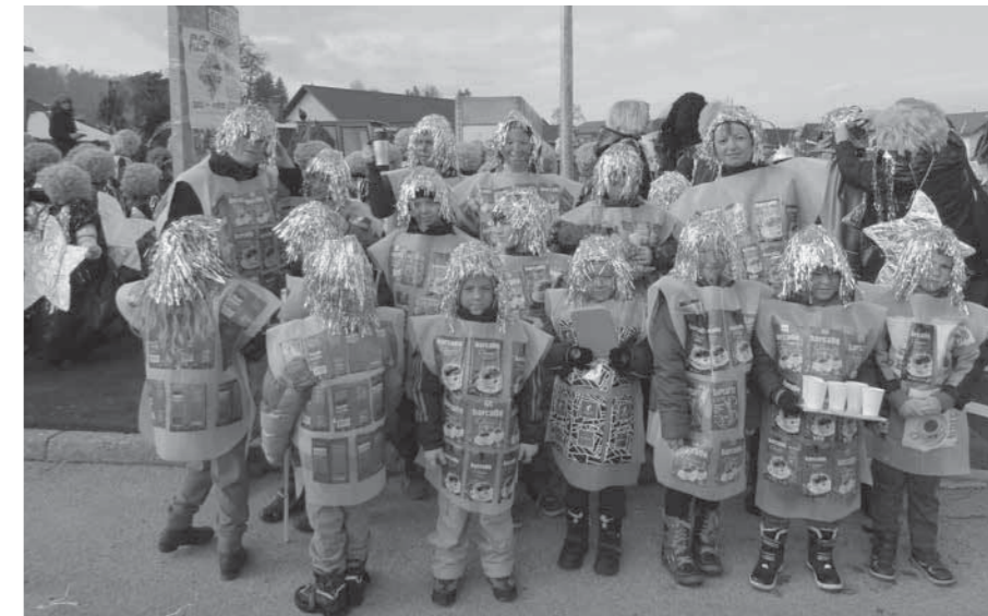
Zadišalo je po kavi

li embalažo za kavo, zamisel se nam je zdela izvirna in z veseljem smo zbirali prazno embalažo za kavo. Hvala vsem,