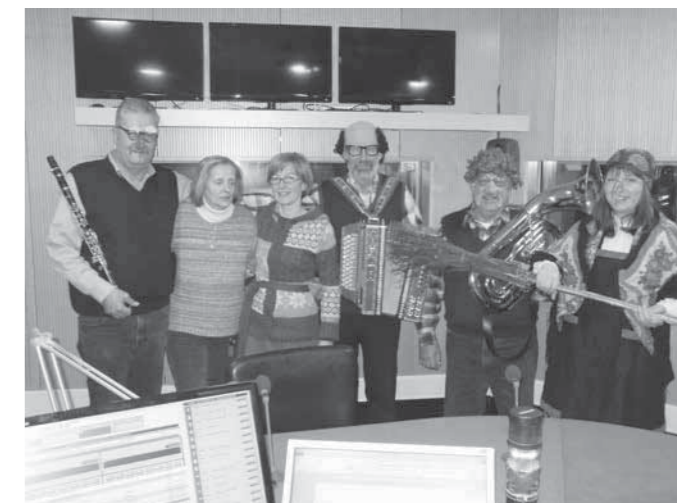
Veseli prijatelji UD Majšperk