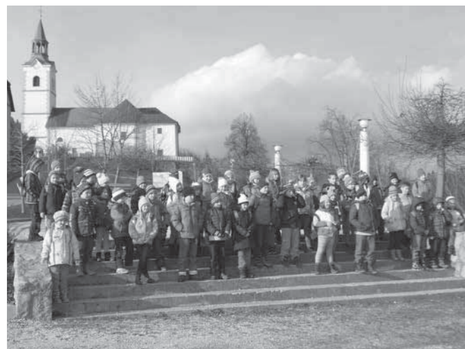
Bilo nam je všeč!