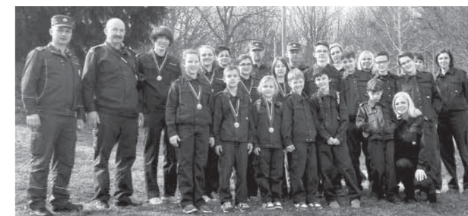
Udeleženci regijskega kviza

dem pri Ptuj, Majšperk in Slovenska Bistrica. Skupaj se je kviza udeležilo 53 tekmovalnih ekip v 3 kategorijah (pionirji, mladinci, gasilci pripravniki). Ekipe so se pomerile v 4 teoretičnih preizkusih znanj in v štafetnem vezanju vozlov/orodja ter vaji, imenovani gasilska spretnost. Gasilska zveza Majšperk je sodelovala s šestimi ekipami pionirjev in tremi ekipami mladincev. V tekmovalni kategoriji pionirjev sta se na regijsko tekmovanje uvrstili ekipi iz PGD Stoperce in PGD Majšperk-Breg 1, v tekmovalni kategoriji mladincev pa ekipi iz PGD Stoperce in PGD Medvedce. Kviz je bil za nas, mentorje, kot tudi za tekmovalce nova izkušnja in prav lepo je bilo videti, da smo vsa društva stala na stopničkih in