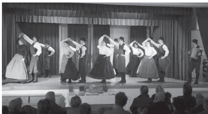
Utrinek s prireditve

Pesem, ki je odmevala v ušesih obiskovalcev šeste antonove prireditve v Stopercah, ki sta jo 17. 1. 2015, dan pred farnim žegnanjem, organizirali folklorni skupini KPD Stoperce. Tokrat so vajeti v svoje roke vzeli plesalci mladinske folklorne skupine KPD Stoperce, ki so se odločili, da bodo letos »ta vlki tak plesali, ko bodo oni igrali«. Rdeča nit prireditve je bil sv. Anton, saj so se mladi morali pozanimati, o kom je sploh govora, zakaj je za vaščane tako pomemben, kakšni so običaji, povezani z njim... In uspelo jim je. Še preveč so izvedeli in tako informacije hitro obrnili v svojo korist ter jo zagodli »ta vlkim plesalcem«. Na dan sv. Antona so ljudje v cerkev včasih nosili klobase, omice... in jih položili na oltar; darovali so jih cerkvi. Po darovanju sv. maši je bila pred cerkvijo licitacija darovanega mesa. Izkupiček je bil cerkvena last. Šesta antonova prireditev je potekala dan pred žegnanjem pri farni cerkvi v Stopercah in člani mladinske folklorne skupine so bili prepričani, da imajo klobase in omice plesalci odrasle skupine že pripravljene za naslednji dan. Odločili so se, da si bodo sposodili meso od odraslih plesalcev. Medtem ko so mladinci polnili svoje »žakle«, so nastopili gostje Folklorne skupine Košuta Poljčane. Predstavili so se nam z za uho in oko prijetnima in plesno razigranima nastopoma, v katerih