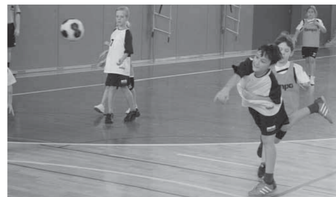
Rokometiši v akciji

Športno društvo Rokometna šola Ptuj nam je omogočilo sodelovanje na mednarodnem srečanju najmlajših rokometišev: »Pikapoka festival 2015«. Srečali smo se z mladimi iz Avstrije,