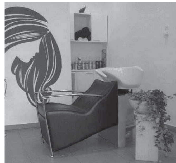
Prijetno urejen frizerski salon

mažu zagotovo ne manjka. Želimo jima vse dobro, tako zasebno kot na poslovni poti. Če imate neukrotljive lase in potrebujete izpiljeno angleško izgovarjavo, pa ju le pokličite. Zagotovo bosta vesela vašega klica.