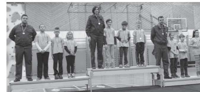
Udeleženci regijskega kviza

Prav tako pa smo letos prvič organizirali in izvedli občinski kviz gasilske mladine skupaj z gasilskimi zvezami Kidričevo, Videm in Slovenska Bistrica. Kviz je potekal v športni dvorani, jedilnici in učilnicah OŠ Majšperk v soboto, 28.02.2015. Na kvizu je tekmovalo kar 58 ekip z mentorji, za izvedbo kviza je skrbelo skoraj 50 posameznikov. Skupaj se nas je tako