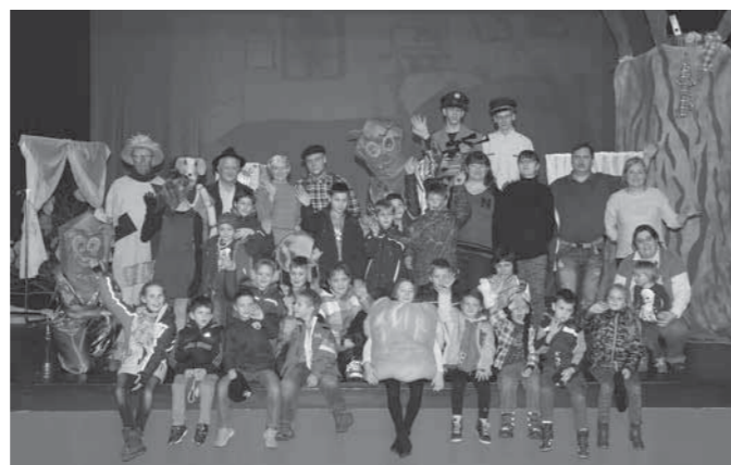
Igralci z učenci

narejeno tudi gnezdo zmaja Tolovaja. ..Všeč mi je bilo, da je bila Žogica zelo poskočna deklica.« Maja, 5.a