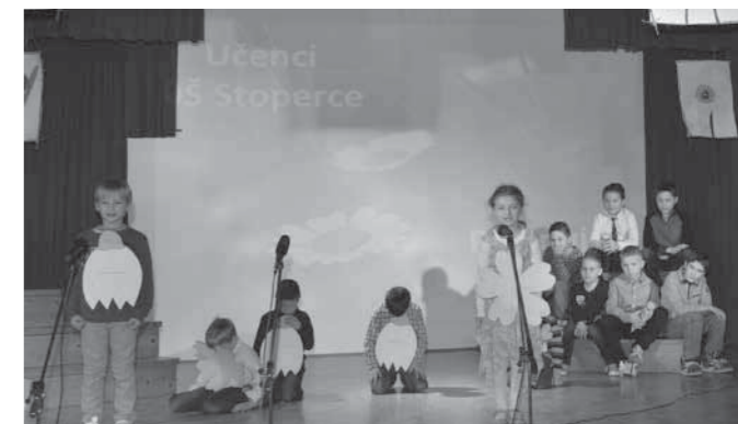
Nastopajoči na prireditvi