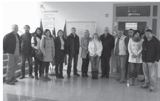
Ob odprtju poslanske pisarne v KPC Majšperk