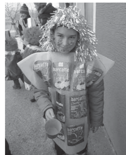
Prikupna embalaža za kavo

Kot vsako leto smo se tudi letos takoj po novem letu pričeli ukvarjati z mislijo o hitro bližajočem se pustu. Ker letos sodelujemo v projektu Taluma, smo izbrali temo, ki je bila povezana s tem projektom. Odločili smo se, da bomo predstavljali izdelke iz aluminija. Po razredih smo določili vsak svojo skupinsko masko. Mi smo predstavlja-