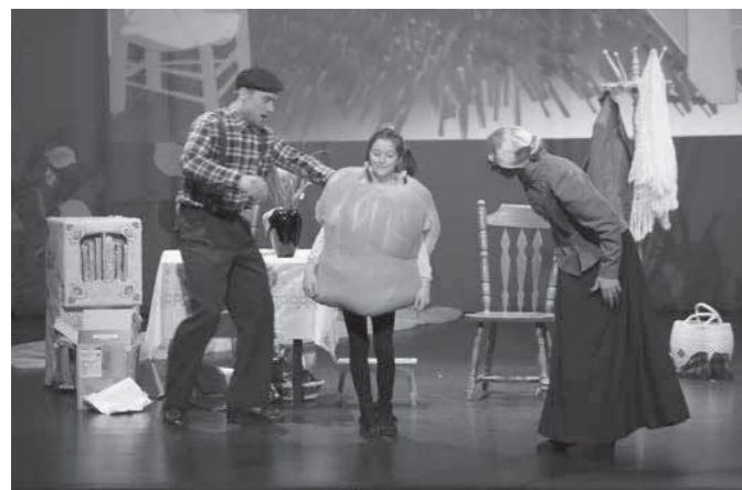
Žogica Nogica razveseli babico in dedka

s pomočjo prijateljev, ki sta jih srečevala med potjo, končno našla gnezdo zmaja Tolovaja. Premagala sta ga lahko samo z močnim pihanjem, pri čemer so imeli otroci v dvorani še posebej veliko vlogo. Velikodušno so pomagali in pihali, pihali, pihali tako, da je žogica Nogica lahko končno objela dedka in babico.