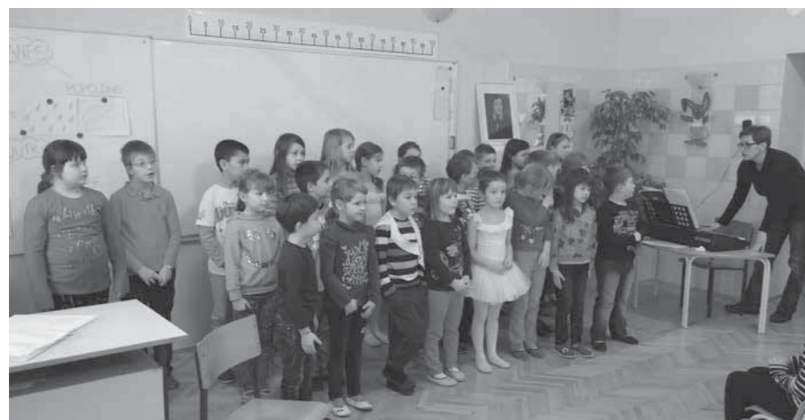
Na prireditvi smo tudi zapeli

hitreje in višje... dokler ne izgineta v deroči Ljubljani.