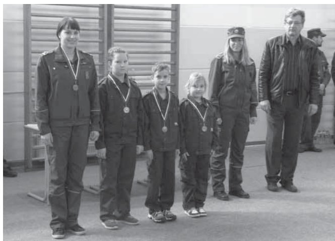
Pionirji PGD Majšperk-Breg na 3. mestu

odnesli domov medalje, kar nas je motiviralo za delo v naprej. Naše zgoraj omenjene ekipe (razen PGD Medvedce) so se tako udeležile 11. regijskega kviza gasilske mladine 2014 v Poljčanah. Za odlično pripravljen prostor, tekmovališče, učilnice in prehrano je poskrbela Gasilska zveza Slovenska Bistrica. Vsi sodelujoči so na začetku prejeli priznanja za sodelovanje, najboljše tri uvrščene ekipe v vsaki kategoriji so na koncu prijele medalje. Prav ponosni smo na mladince iz PGD Stoperce, ki so naš uspešno zastopali in dosegli 3. mesto. Med 23. in 24. januarjem 2015 se je v Zrečah odvijal posvet mentorjev mladine, ki sva se ga udeležili dve mentorici naše gasilske zveze. Na posvetu so potekale tudi delavnice na temo prve pomoči in priprave orientacijske karte, poudarek pa je bil na spremembah v kvizu za leto 2015. Ta se iz jesenskega