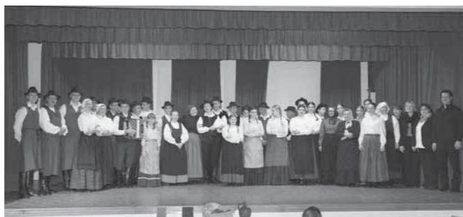
Nastopajoči v Stopercah

smo imeli čast spoznati čisto ta pravo košuto. Čeprav mladinski folklorni skupini letos ni uspelo izpeljati čisto »ta prave licitacije« (priznajmo, da je odrasla skupina bolj izkušena),