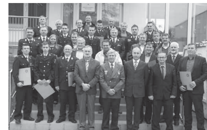
Zbrani v Podlehmiku

Prostovoljnost pomeni, dati dan in noč, dati družino in službo, dati vse svoje, tudi življenje, in delati profesionalno, tvegano, umazano in grdo