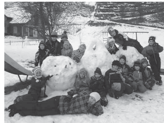
Uživanje na snegu

Pa smo okrog božiča že mislili, da ne bo snega...Že drugi dan, po novoletnih praznikih smo v Stopercih izkoristili precej snega, ki je še ostal v senčnih legah in se sankali po hribu za domom krajanov. Saj veste, dandanes več ne veš ali še bo kaj snega ali ne, zato moramo izkoristiti vsako priložnost in se prepustiti zimskim radostim. A k otroški sreči to