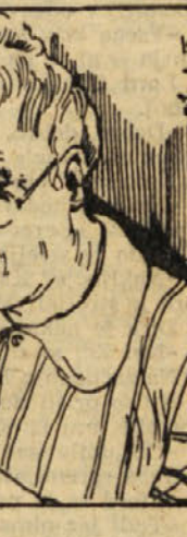
Ris: Milan Batista

5. - »Tom!« - Tetka Polly je poklicala fanta. - »Tom!« - Nič odgovora. - »Tom!« - Vse tiho... »To-o-om!« In spet nič. »Kje neki je le? Da se mu ni kaj zgodilo?« - Nataknila si je očala in za hip umolknila. - »Le počakaj malo, smrkavce ti grdi!« Prijela je metlo in segla pod posteljo. Toda ničesar drugega ni bilo tam razen mačke. Vzravnila se je in lovila sapo od prevlečnega napora ter še enkrat zaklicala: »To-o-om, To-o-om!«