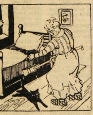
Prisrčili: Ivan Abram