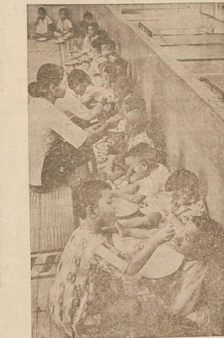
OBED V SIROTIŠNICI — V sirotišnici v Saigonu, glavnem mestu J. Vietnama, pomagajo starejše sirote mlajšim pri jedi.

Oddamo 4 lepe sobe in kopalnico zgoraj, čisto, mirno, blizu sv. Vida, 1 ali 2 osebi, nič otrok, prista gorkota, vroča voda. Kličite 431-9783. —(119)