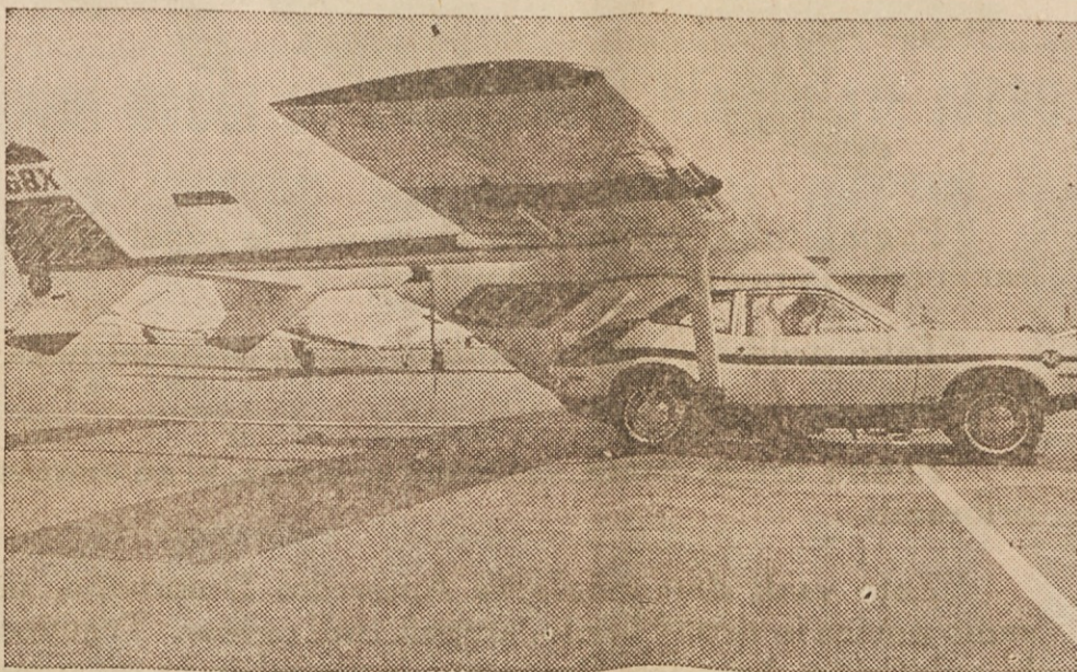
PO CESTI IN PO ZRAKU — Slika kaže povezavo letalskega okvira s motorjem Cessna Skymaster in avtom Pinto Fordove družbe. V dveh minutah je mogoče avto in letalo združiti v enoto, sposobno za dvig v zrak. Preskušanje te povezave in njeno praktično uporabo še niso končali.