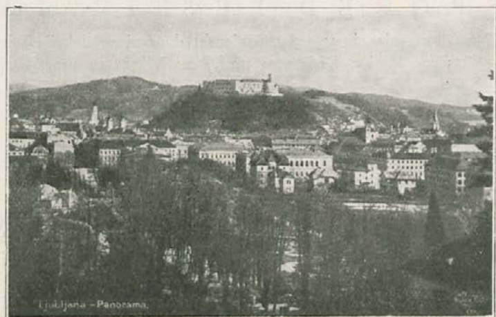
Ljubljana - Panoramska.