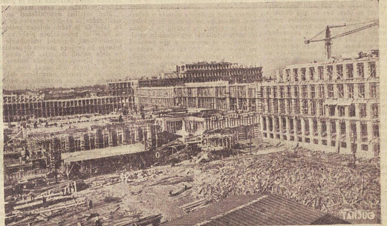
Našinci iz vse Jugoslavije gradijo največji objekt v Novem Beogradu — zgradbo predsedstva vlade. V tekmovalju za 29. november so povečali svojo delavnost, da izpolnijo obveznost, dano Partiji in ljudstvu

Med velikimi deli Titove petletke je po svojem gospodarskem pomenu, kot velika kovačnica strokovnih kadrov, kot prva šola za tisoče mladincev, za okrepitev bratstva in enotnosti naših narodov in herojskih naporov Ljudske mladine Jugoslavije, zavzela svetlo mesto tudi Avtostrada.