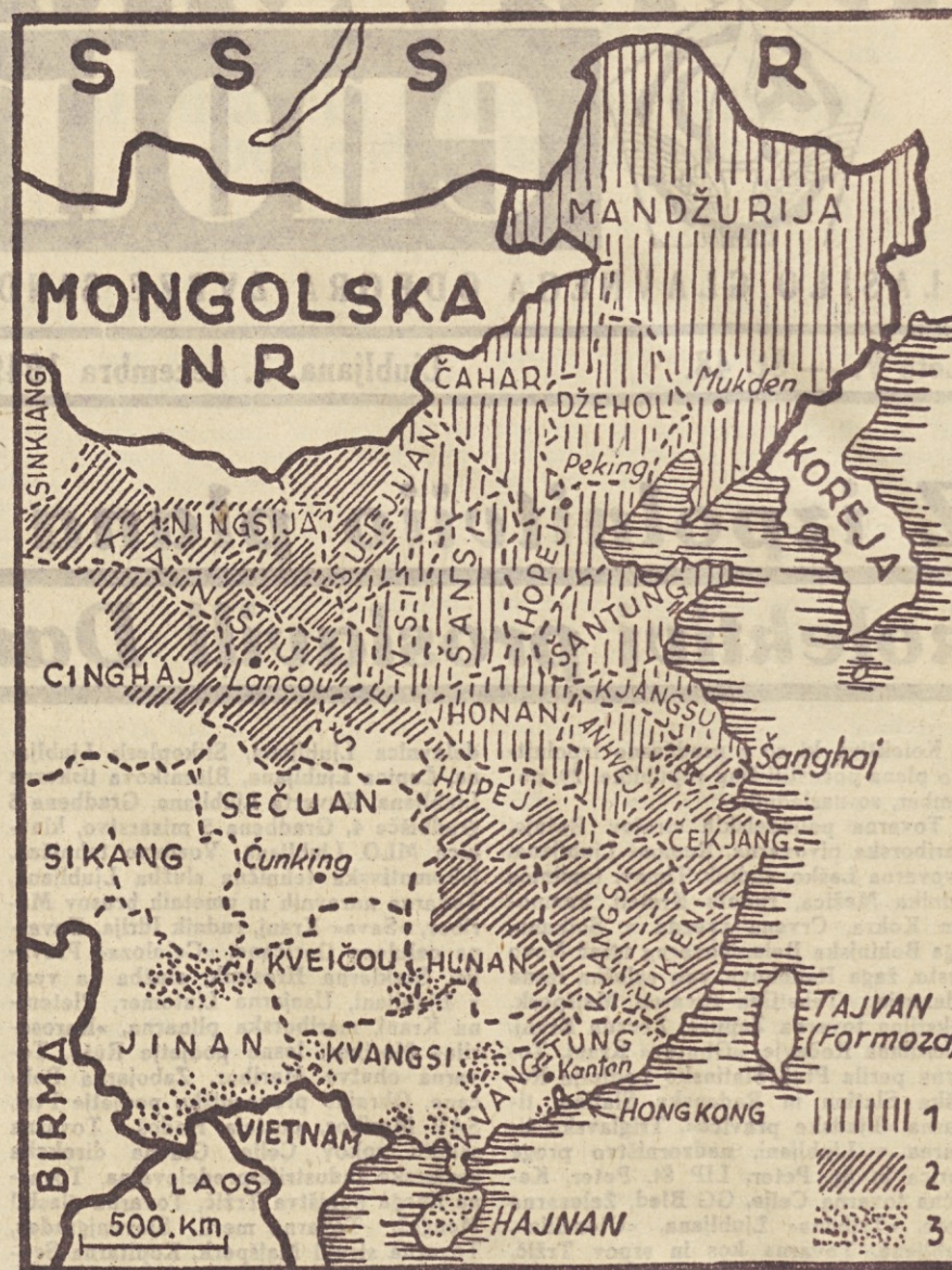
1. Osvobodjeno ozemlje pred letošnjo poletno ofenzivo. 2. Med poletno ofenzivo 1949 osvobodjeno ozemlje. 3. Po partizanskih odredih osvobodjeno in kontrolirano ozemlje.

Velika nova ofenziva narodnoosvobodilne armade Kitajske, ki se je začela v novembru v pokrajini Szechuan, Kweichou in Kwangsi proti nacionalistični prestolnici Čunking, je enotam Mao-Ce-Tungove vojske prinesla nove zmage. Po zadnjih vesteh so medtem čete narodnoosvobodilne armade Kitajske že popolnoma osvobodile Hunan in Hupej v jugozahodni Kitajski in globoko prodirle v Szechuan in Kweichou.