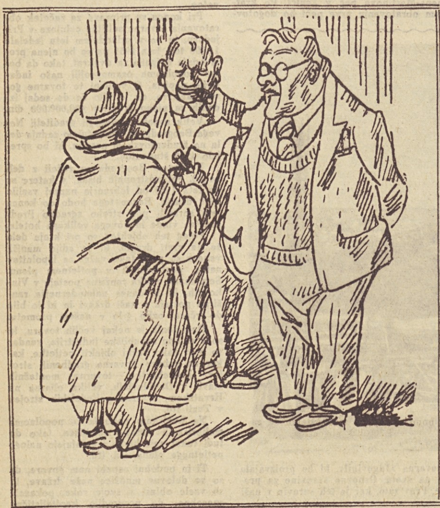
— Gospod Višinski, zakaj sovjetska delegacija ni glasovala za jugoslovanski načrt deklaracije o dolžnostih in pravicah držav? — Glasovala ni zato, ker... v deklaraciji niso določene pravice velikih in dolžnostih majhnih držav! (Ilustrirani vjesnik)