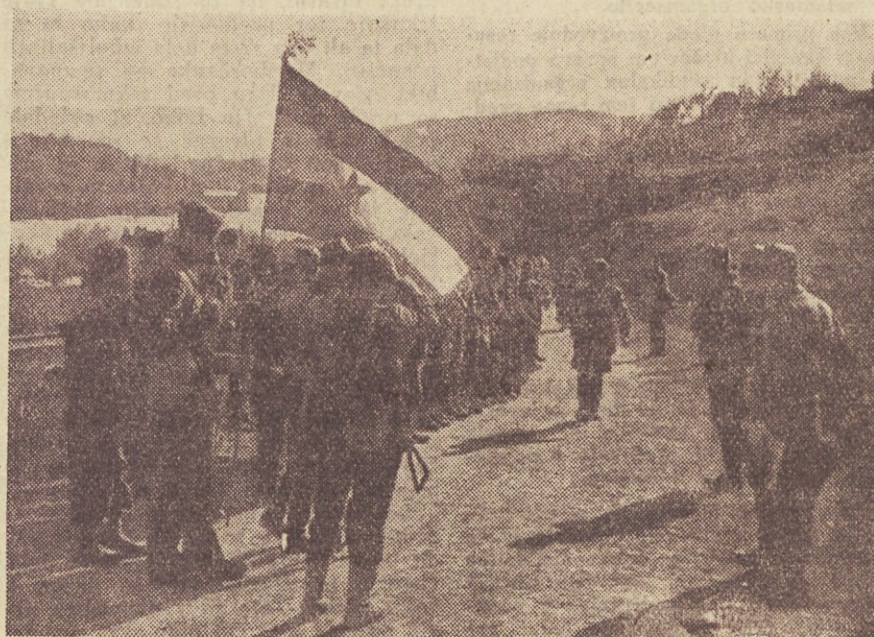
Naše brigade na zboru pred akcijo

Zaradi porušene in prenapolnjene ceste smo morali del poti prehoditi peš. Velik del zaščite, ki je spremljala Lehra na kamionih in oklopnem avtomobilu,