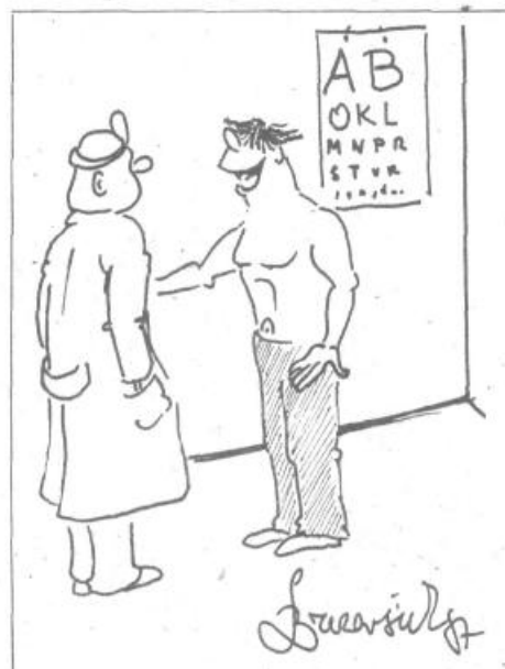
Ampak gospod doktor, kaj naj pijem, ko pa ne smem ne vode, ne kave, ne alkohola...?