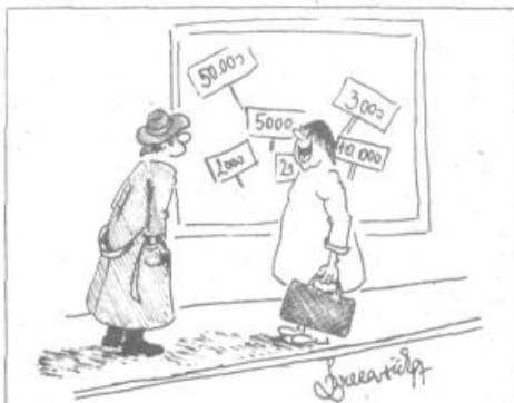
Kdo pa se pritožuje nad skromno maloprodajno mrežo, ko pa bo še ta kmalu prevelika!

Od skupno 98 prodajal jih je 59 z živili in gospodinjstvi, 20 je trgovin z mesom in perutnino, 16 je trgovin s sadjem in zelenjavo (od tega je 12 kioskov) ter tri prodajalne s kruhom.