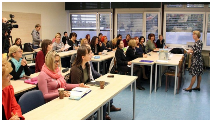
Izobraževanje vzgojiteljev in vzgojiteljic (Maribor, 21. 10. 2016)