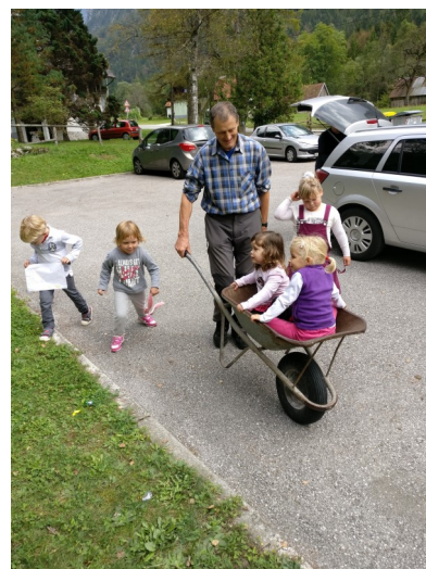
Dan odprtih vrat - igra malo drugače.

Skupaj je v domu, v 1161 nočitvah, bivalo 457 gostov, od tega 110 tujih. V MDPM za Goriško smo presegli načrte, ki smo si jih zastavili v prvem letu upravljanja doma. Ponosni smo tudi nad tako zelo mešano strukturo udeležencev in vsebin, ki smo jih v tem letu uspeli izvesti oz. gostiti v domu Triglavska roža.