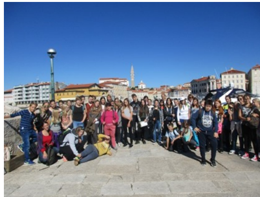
Udeleženci Ex tempora v Piranu.