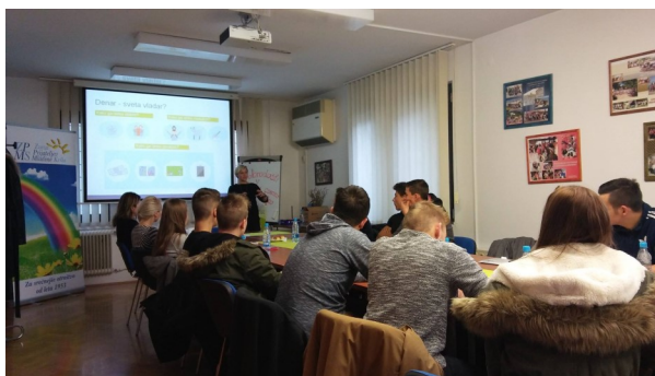
Delavnica za mlade v Krškem.

Prijavi se na: info@mzpm-ljubljana.si in skupaj z nami sooblikuj zdrav odnos do denarja.