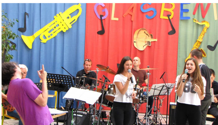
Utrinek iz generalke Glasbenega izziva 2015.

Izbrani glasbeniki bodo najprej vadili doma in nato skupaj z orkestrom. Za vsako skladbo bo tudi narejen glasbeni aranžma. Projekt se bo zaključil s slavnostnim tekmovalnim koncertom v aprilu ali maju 2017, ob spremljavi Special orkestra.