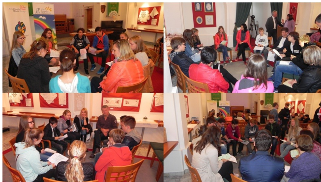
Delavnice z učenci.

Ugotovitve mladih bodo služile kot izhodišča za šolske in občinske otroške parlamente, ki bodo predvidoma marca naslednje leto.