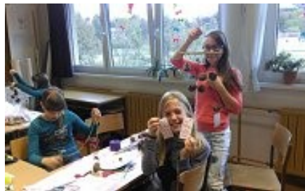
Teden otroka® v Čepovanu.

Starejši otroci so nam zaupali, da želijo živeti v svetu, kjer bi imeli vsi otroci ljubeče družine in topel dom, kjer ne bo lakote, vojn, sovraštva in bi živeli v miru. Mlajši otroci pa si želijo predvsem prijateljstvo, da ne bi bilo šole in da bi bil svet poln čokolade in bonbonov... Da bi se jim želje uresničile, smo izdelovali vetrne zvončke želja (t.im. mobile) iz storžev, nanje obesili kartončke z napisanimi ali narisanimi željami. Vetrne zvončke so otroci obesili doma, na prostem, kjer jih je dosegel veter in njihove želje raznosil na vse strani sveta. Držimo pesti, da se bodo čisto vse želje izpolnile.