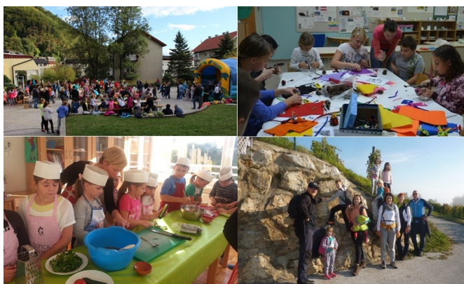
Pester Teden otroka®.

V času od 3. do 9. oktobra so se v okviru Tedna otroka® v organizaciji Zveze prijateljev mladine Krško in društev prijateljev mladine v občini Krško in Kostanjevica na Krki odvile številne prireditve za otroke, mladostnike in družine. Skupaj je bilo organiziranih deset prireditev na različnih lokacijah občin Krško in Kostanjevica na Krki. V Koprivnici so v ponedeljek, 4. oktobra, pripravili jesenski pohod otrok s starši, ki se je zaključil pri Gasilskem domu Veliki Kamen s kostanjevim piknikom. V sredo,