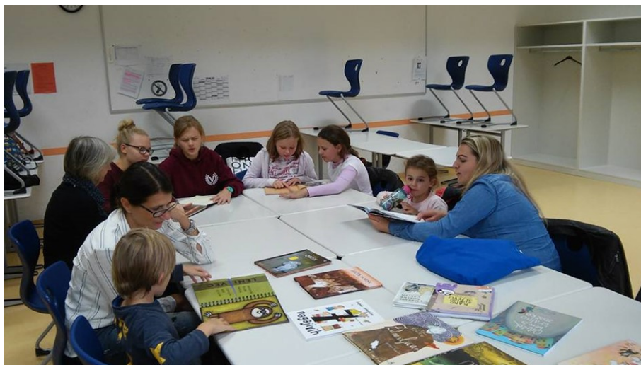
Bralna delavnica v Memmingenu

Iskreno se zahvaljujemo vsem učiteljem dopolnilnega pouka slovenščine v Nemčiji ter podpornikom projekta - Uradu za Slovence v zamejstvu in po svetu in Javni agenciji za knjigo RS.