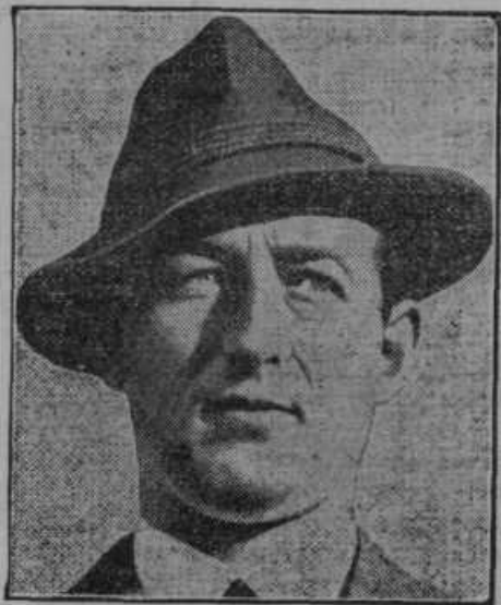
Avstrijski knez Starhemberg je izpadel kot podkancler iz dr. Schuschniggove no- ve vlade.

Iz rumenega napraviti belo — nobeno čarodejstvo! Koliko gospodinj toži, da je njihovo pe- rilo, poprej tako lepo belo, že po nekoliko pra- njih porumenelo. Ker trud in muka, vse men- canje in drgnenje nič ne pomaga — perilo je in ostane rumeno. Pa vendar ni nobeno čarodej- stvo, dobiti zopet lepo belo perilo. Za pranje se mora vzeti samo zares dobro milo — Schichto- vo terpentinovo milo. To čisto jedrnato milo od- pravi brez truda in prizanesljivo vso nesnago iz perila. Schichtovo terpentinovo milo pere ble- ščeče belo.