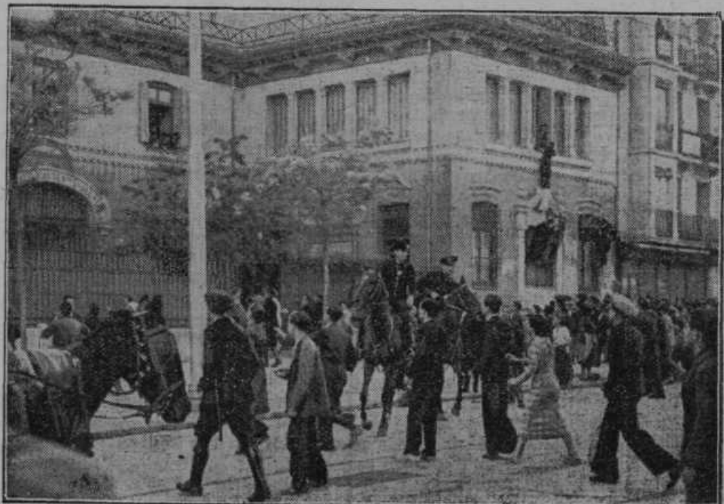
Španski komunisti napadajo samostan.