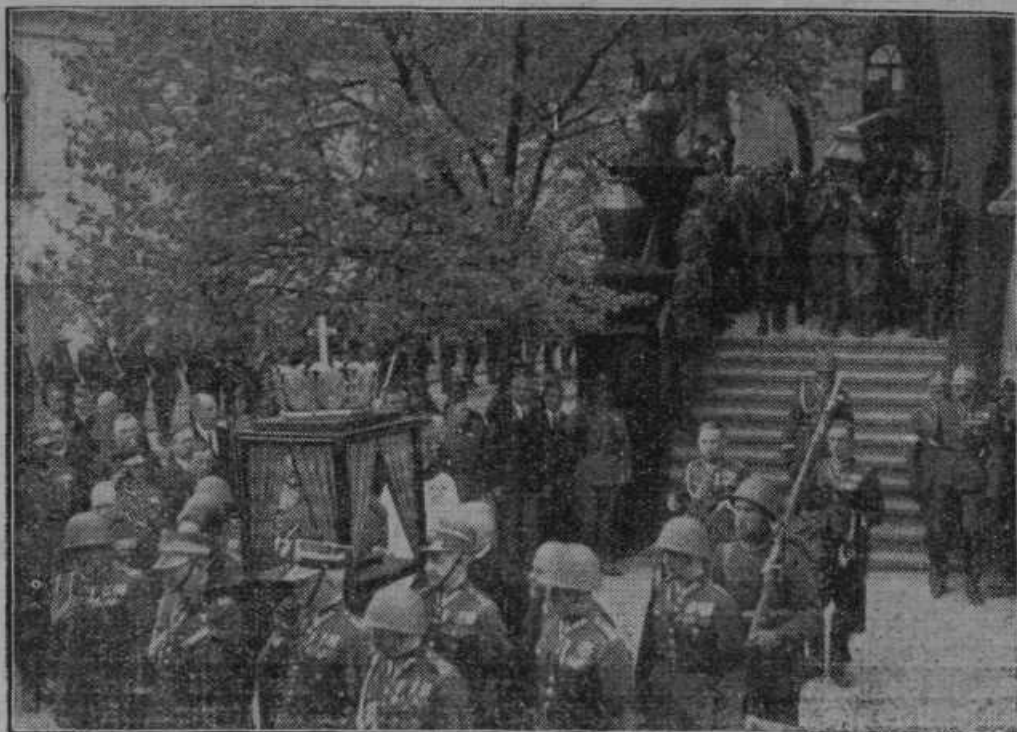
Na dan obletnice smrti poljskega maršala Pilsudskega so položili maršalovo srce k ostankom njegove matere v Vilni.