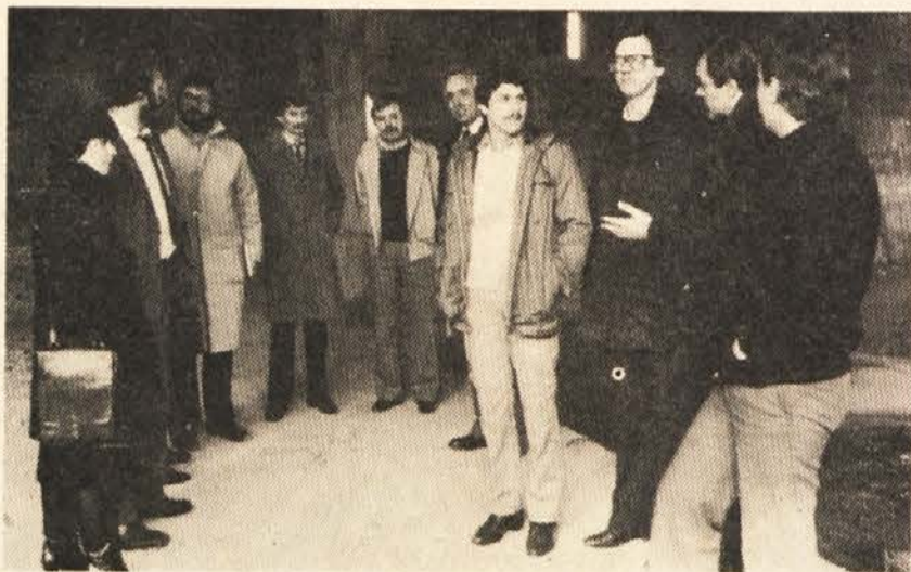
Delegacija si je ogledala tudi gradbišče novega doma