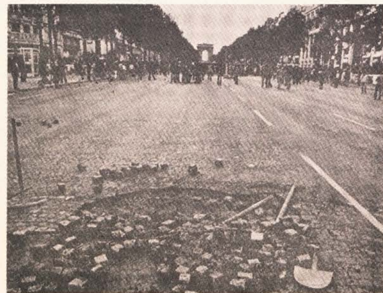
Razstava bo odprta do 25. marca 1983, od ponedeljka do petka, od 13.00 do 17.00 ure.

ki bo v ponedeljek, dne 14. marca 1983 ob 19. uri.