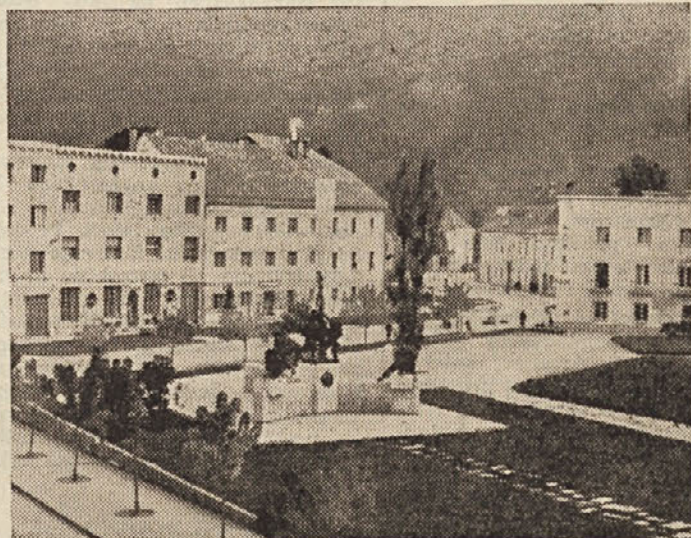
Kočevje je danes lepo urejeno

Novi predsednik Zvezne ljudske skupščine Petar Stambolič je bil rojen 12. julija 1912 v vasi Brezo- vici pri Ivanjici, LR Srbija. Gim- nazijo je kot študent sodeloval pri delu napredne demokratične uni- verzitetne mladine. Član SKOJ je postal leta 1933, leta 1935 pa član KPJ. Vojna ga je zatekla v Va- ljevu. Takoj po kapitulaciji je bil poslan na partijsko delo v Pomor- ravje, kjer je organiziral vstajo. Od konca leta 1953 je bil predse- dnik LS Srbije, kar je še sedaj. Odklikovan je bil med drugim tudi z redom narodnega heroja.