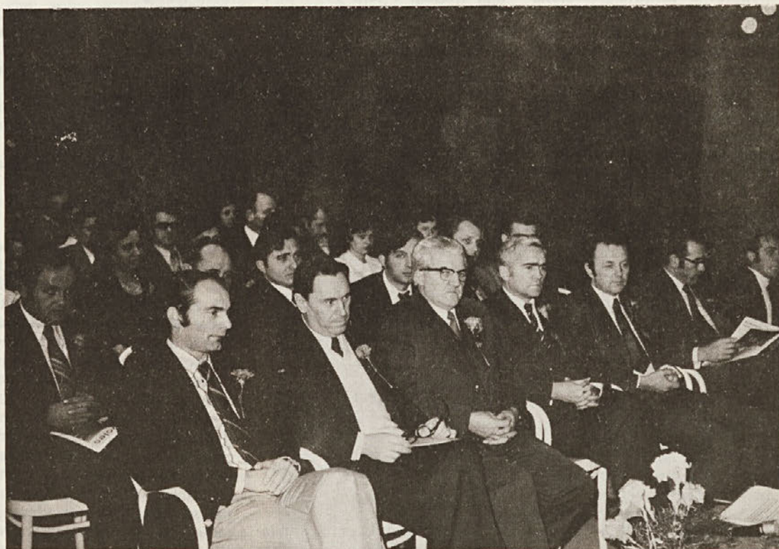
Gostje na svečani seji

Ali so ti rezultati veliki ali majhni? Verjetno so podjetja, ki lahko izkažejo tudi večje, vendar ne v pogojih naše proizvodnje in poslovne usmeritve. Na te rezultate smo torej lahko in moramo biti ponosni. S tem namreč dajemo priznanje znoju, ki se skriva za temi suhim številkami.