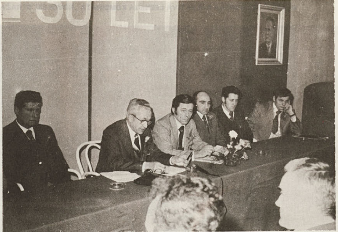
Delovno predsedstvo slavnostne seje

Zato dajem predlog delavskemu svetu, da naroči za bodočo 35-letnico kroniko Novolesa in njegovih ljudi – predvsem ljudi.