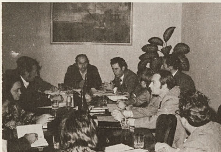
Minuli mesec je bila v Straži seja delavskega sveta Unilessa, na kateri so razpravljali o nekaterih perečih gospodarskih vprašanjih in o delovnem planu za letos