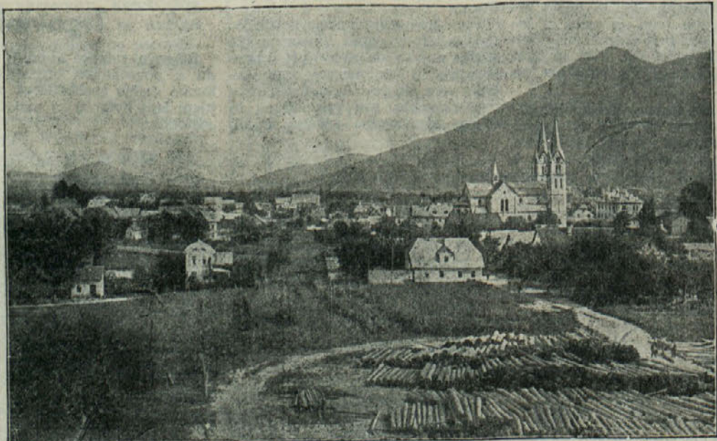
Ta slika predstavlja Kočevje pred 25 leti. Posneta je bila izpred železniške postaje. Iz majhnega mesteca se naglo razvija novo industrijsko mesto

O potrebi gradnje novega šolskega posvetja v Velikih Laščah smo v našem listu že poročali. Zvedeli smo, da se bo dolgoletna želja prebivalcev Lašč in okolice, da dobijo novo šolo, le izpolnila. Za gradnjo šole je odobreno že pet milijonov dinarjev, tako da bodo s pripravljanimi deli (izdelavo načrtov itd.) lahko čimprej začeli. Kmetijska zadruga Lašča pa je za gradnjo šole kot prva določila 100.000 dinarjev.