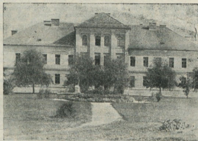
V Kočevju vedno bolj primanjkuje šolskih prostorov. Z dograditvijo vajejnškega doma, bo Bračičeva šola dobila prostoro sedanjega vajejnškega doma

Za stanovanjsko graditev je v letu 1960 iz občinskega stanovanjskega sklada predvidenih 168,9 milijonov dinarjev. Iz republiškega stanovanjskega sklada bo dan kredit v višini 35 milijonov dinarjev za gradnjo stanovanj za Rudnik rjavega premoga Kočevje in Kmetijsko gozdarsko posestvo Kočevje. Z družbenimi sredstvi se bo v letu 1960 gradilo 120 stanovanj, v zasebni lastnini pa je v gradnji še 40 stanovanj. Do konca leta bo vsejlihi okoli 59 stanovanj. Da se bo omogočila pospešena gradnja stanovanj, bo treba v čimvečji meri v stanovanjsko gradnjo pritegniti tudi sredstva zasebnikov — stanovanjskih interesentov in sredstva podjetij, da bodo s tem zagotovljena stanovanja svojim delavcem. Gradnja stanovanja naj se vrši po tipskih projektih in v naprej določenih urbanistično urejenih kompleksih, s čimer bo omogočeno racionalno organizirati velika gradbišča. Velikost in ceno stanovanj je prilagoditi finančni zmogljivosti uporabnikov.