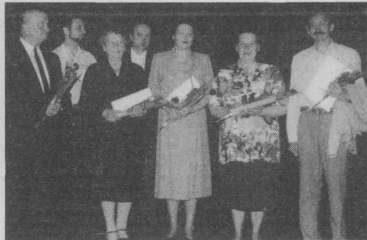
Priznanja KS Moste-Selo so letos prejeli:

dramska igralka, ki je obenem tudi programski vodja KD ŠB. Na proslavi so podelili tudi priznanja krajevne skupnosti Moste-Selo.