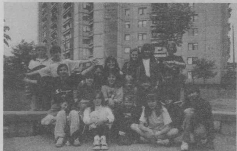
Dramski krožek OŠ Nove Fužine sredi betonske soseske, v kateri jim ni dolgočas, saj znajo poskrbeti za prijetna in kulturna presenečenja.

– V KS še vedno deluje posredovalnica občasnih in honorarnih del. Iskalce zaposlitve vabimo, da pridejo, še bolj pa tiste, ki sodelavce potrebu-