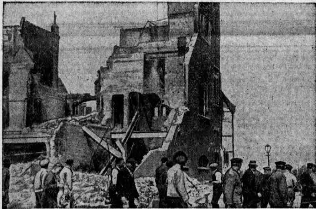
Skoraj ni več ostal kamen na kamnu.

L. 1896. se je v Tihem oceanu potopila angleška jadrnica »Kent« z vso posadko. Nihče ni takrat vedel, kako se je nesreča zgodila, jadrnice ni bilo v namembno pristanišče in se nikdar več ni pojavila na morju. Pred kratkim pa je neki ribič z otoka Upolu (v skupini Samoa-otočja) našel na obrežju steklenico, v kateri je bilo zapečateni zadnje poročilo neke ladje, ki se je potopila. Steklenico je izročil oblastem, ki so jo poslale v Anglijo, tam pa so jo odprli in našli, da je v steklenici poročilo kapitana o potapljanju zgoraj omenjene jadrnice in obenem tudi njegov testament. Ker kapitan ni imel nobenih sorodnikov, je v tem testamentu, ki je prišel na dan šele po 43 letih, vse svoje premoženje zapustil sinu nekega tovariša, ki je bil takrat še v mornariški šoli. Njegovo premoženje takrat ni bilo veliko, v teh letih pa je z obrestmi naraslo na 30.000 funtov. Oblastem se je po dolgem iskanju posrečilo najti pravega dediča. Takratni učenec pomorske šole je danes že star mož, ki se je že umaknil z morja in uživa skromno rento. Toda tudi on se ni maral polastiti bogastva, ki mu je tako nepričakovano padlo v naročje, ampak je vse to premoženje iz tega testamenta zapustil domu za stare pomorščake.