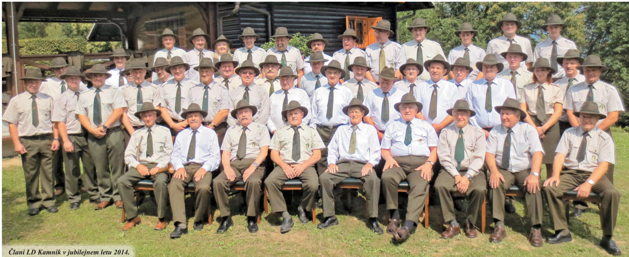
Člani LD Kamnik v jubilejnem letu 2014.