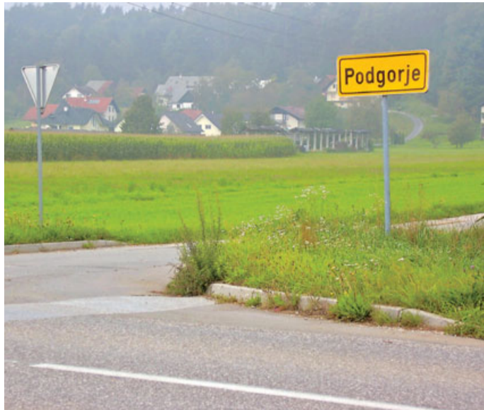
Zavajajoča tabla naselja Podgorje.

od udeležencev v cestnem prometu pričakuje, da jo bodo zlahka in pravočasno opazili in dojeli njen pomen ter da se bodo lahko na podlagi postavljene prometne signalizacije in prometne opreme cest ravnali v skladu s pomenom oziroma zahtevami, ki so določene (izražene) s postavljenimi prometnimi signalizacijami in prometno opremo cest.« Tega člena Pravilnika postavljaivec opisane prometne signalizacije ni upošteval.