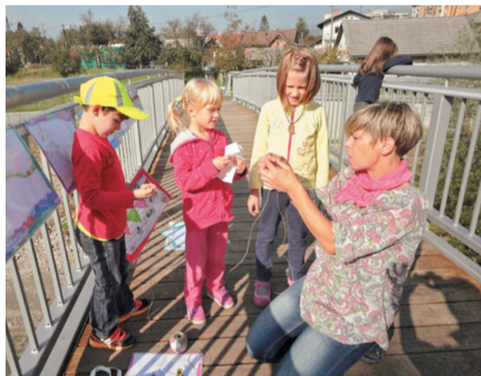
Otroci in vzgojiteljice Vrta Sneguljčica so most okrasili z risbicami.