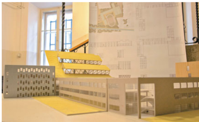
Do sredine oktobra je v občinski stavbi na ogled razstava Kamnik 2020, na kateri študentje arhitekture predstavljajo svojo vizijo urejanja prostora v kamniški občini. Študentje tretjih letnikov so pripravili večje strateške projekte, med drugim knjižnico in glasbeni center, srednješolski center, zimski pokriti bazen, potniški terminal in alpinistični center. Marsikatera prostorska tema je že sedaj aktualna, razstava le nakazuje prostorske možnosti in vizijo našega mesta, kakšne pa bodo finančne zmožnosti in odločitve odgovornih na projektih, povezanih z urejanjem prostora, pa je že druga zgodba.

prostoru. Kako zadostiti razvojnim pritiskom in potrebam v prostoru, obenem pa ohraniti in zagotoviti trajnostno kakovost prostora, ki bo hkrati privlačen za prebivalce in kot tak potencial uspešnega gospodarskega razvoja, vir blagostanja in kakovosti bivanja, je vprašanje, ki se nam v spreminjajočih pogojih gospodarskega, demografskega in