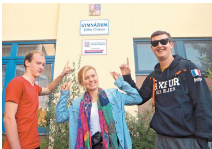
Češko-slovensko prijateljstvo – 2. del