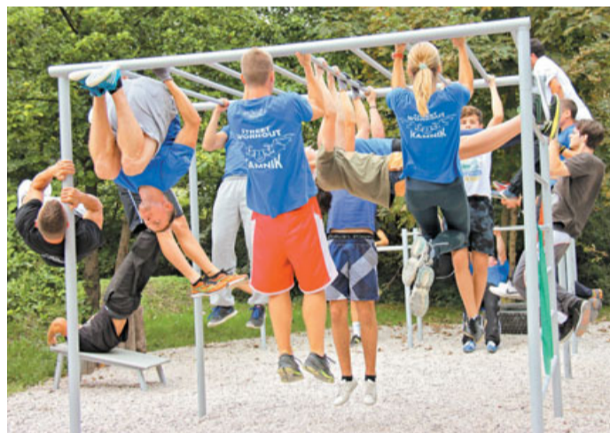
Z atraktivnimi točkami so navdušili še člani skupine Street Workout Kamnik, ki so v neposredni bližini mostu z veliko dela in zagnanosti ob pomoči Občine Kamnik postavili telovadna orodja na prostem.