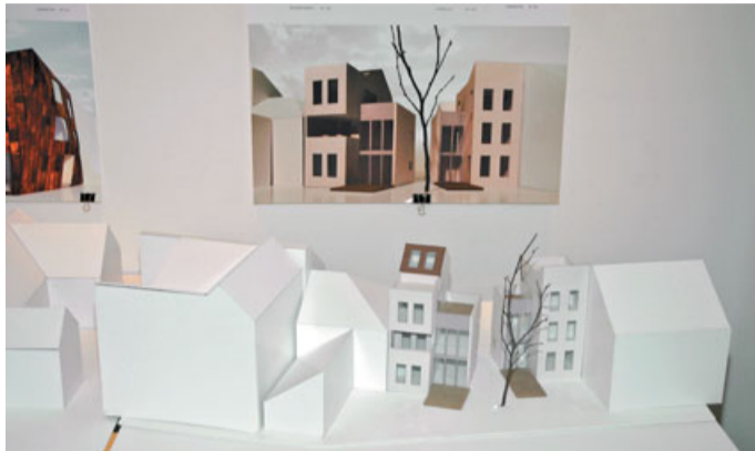
Študentje drugega letnika so iskali rešitve stanovanjskih vzidav znotraj ožjega mestnega središča, četrta letniki pa so v Šmarco postavili ekovas in preverjali, kako bi se lahko znotraj obstoječega naselja ustvarilo svojevrstno ekološko – trajnostno – bivalno okolje.

Štajnovci želijo z razstavo opozoriti na problematične tematike in v ospredje postaviti dejstvo, da je še ogromno pro-