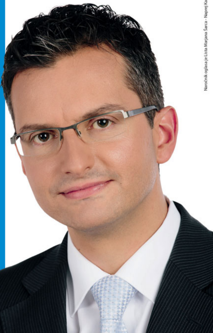
Naročnik oglasa je Lista Marjana Šarca - Naprej Kamnik.